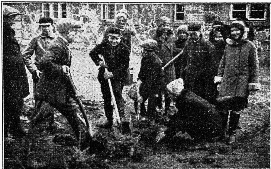
Maanoored uusi traditsioone loomas.

väärtusi kaldub mõõtma vaid materjalismi mõõdupuuga.