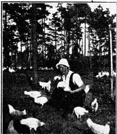
Raske on — aga muna tuleb.

Õige kana toit peab rohkelt munavalget sisaldama. Seda saadakse, kui mitmekesise teraviljast põhiseгу kõrval anname järjekindlalt ikka söötadest: 45 liha, purustatud tooreid konte, kalajahu (pepsi tint), piima rõõsalt või paksult (ainult mitte tilgastanult),