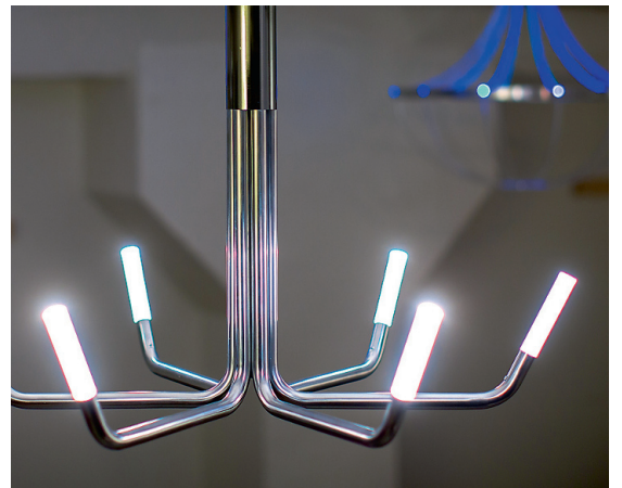
Moderne LED-lühter Glow.