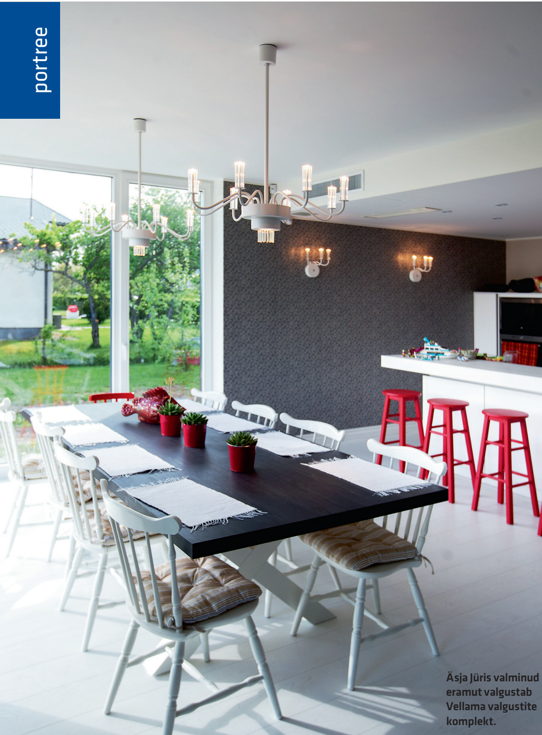
Äsja Jüris valminud eramut valgustab Vellama valgustite komplekt.