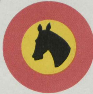
14-a Tee hobustega sõitjaile suletud