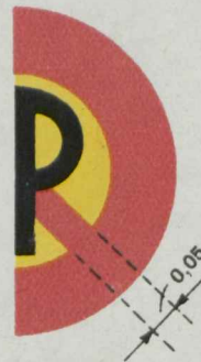
19-a Parkimine keelatud tee ühel poolel