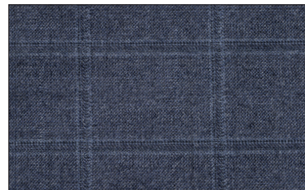
• TAGLIATORE Puhast uusvillast, ruuduline, tavalise laiatriibulise alternatiiv.

KAHENÖÖBILINE JAKK vooderdatud, seljaosal topeltlõhik, kolm sisetaskut, millest üks nööbiga, välitaskud klapiiga, rinnatasku, metallist kullatud nööbid brändi reljeefmärgiga. Hind 450 eurot. brooksbrothers.com