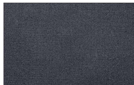
• BROOKS BROTHERS Ekstraõhukesest villast bleiser, sinkjas, kullatud nööpidega.