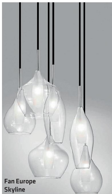
Fan Europe Skyline