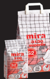
mira 3130 superfix