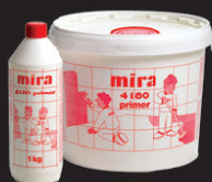
mira 4180 primer

Aluspinna peab olema vähemalt 1% kalle trapi või serva suunas. Veenduge, et kasutatavad keraamilised plaadid sobivad välitingimustesse ja ei ole libedad.