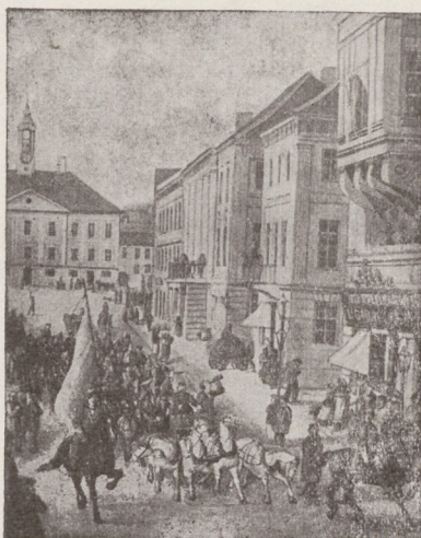
Üliõpilaselu Tartus XIX sajandi II poolel.