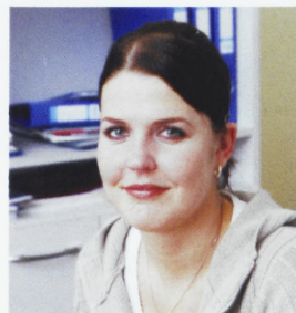
Ivi Papstel Turundusosakonna juhataja

Mulle tundub, et viimased aasta või paar on ka kooli töötajaskond senisest enam hakanud ÜOVD märkama ning nende olemasolu aktsepteerima. See on ju eriti positiivne! Win-win .