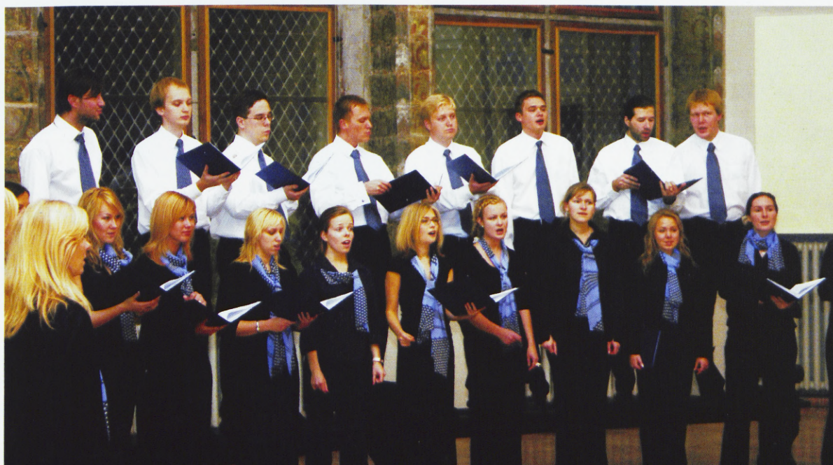
EBS Kammerkoor plaadiesitluskontsertil