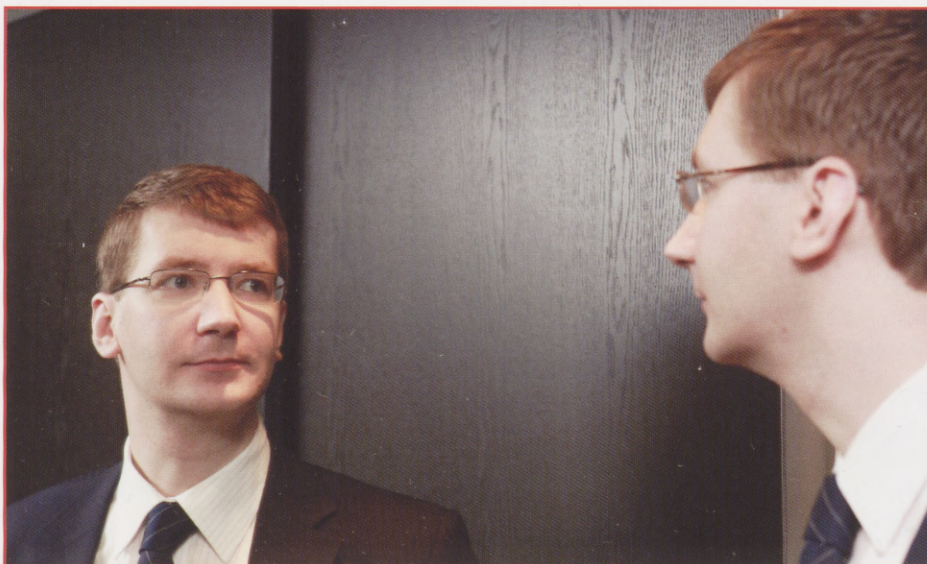
Suutmatu delegeerida kalliks muutunud südamelähedasi tegevusi võib osutada juhi suurimaks komistuskiviks.