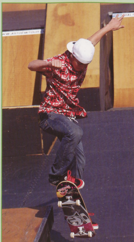
Ryan rulaga trikke tegemas.

Ryan Sheckler sündis 1989. aastal San Clementes Californias. Kõigest 18 kuu