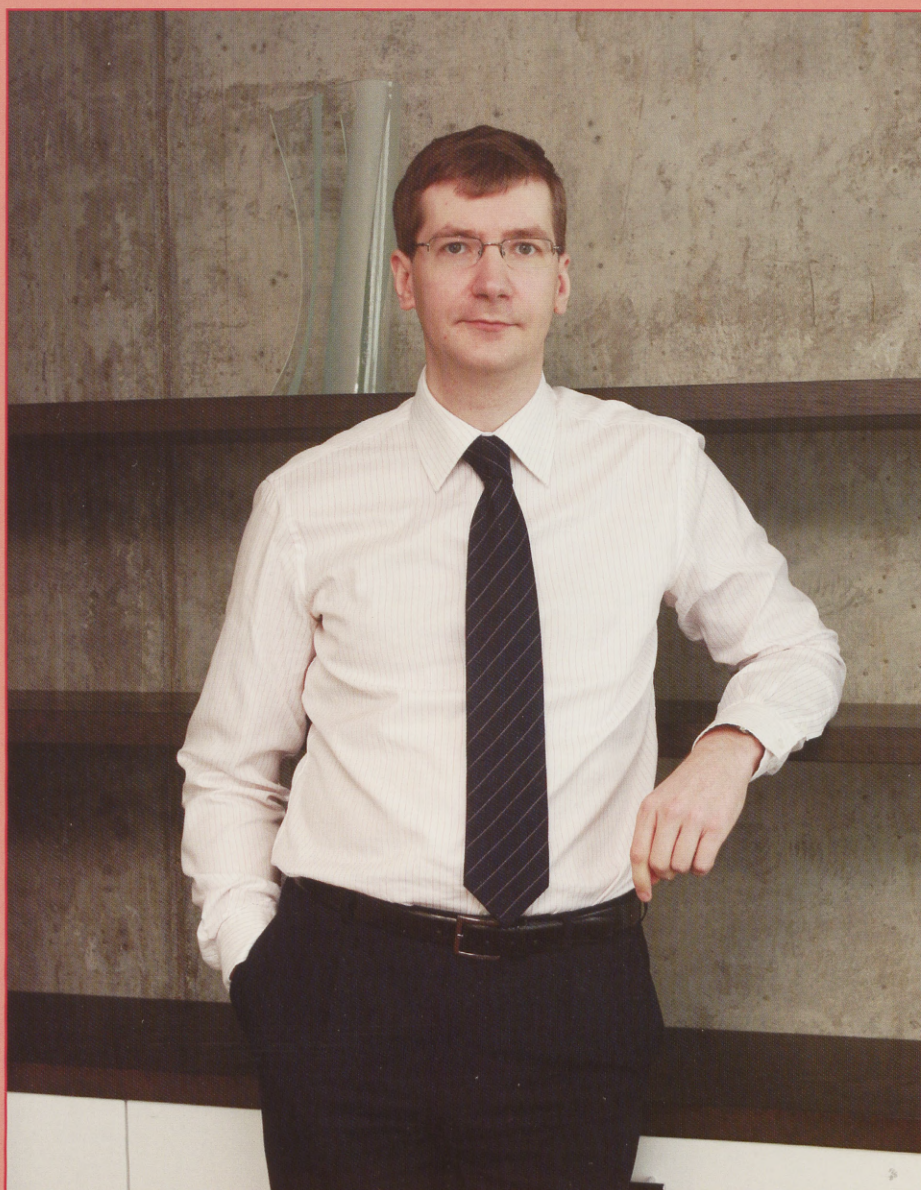
Ülioluline on südikus, alustatud asjad tuleb suuta lõpuni viia!