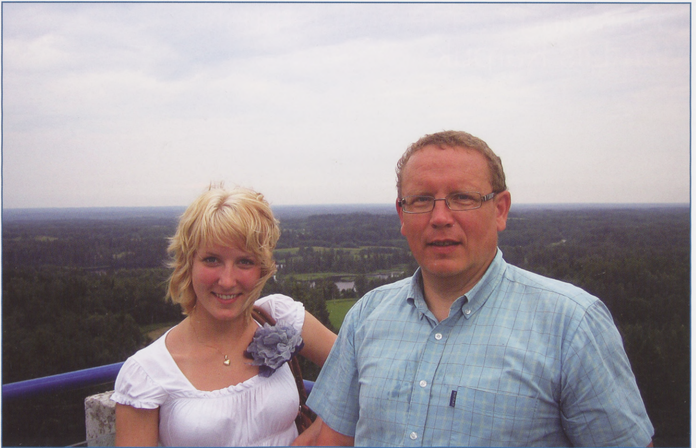
Nüüd aga Eestimaa pinnal koos oma väga multifunktsionaalse isaga.