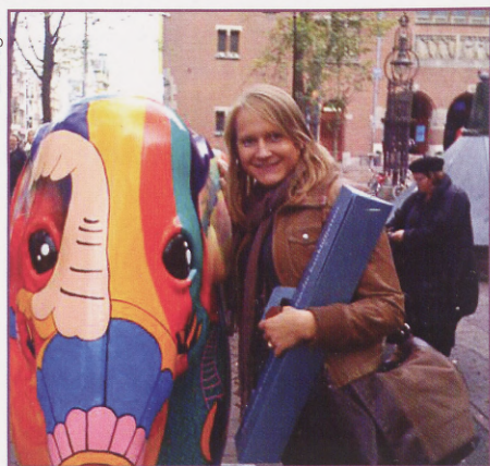
Ekskursioon Hollandi Keskpanga. Amsterdam, Börsiväljak.