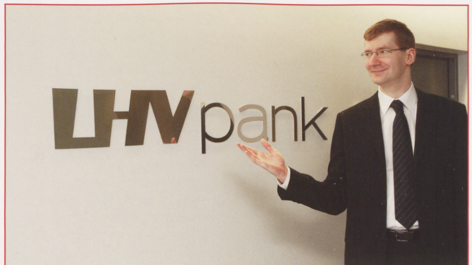
LHV Pank paneb Eesti hariduse parendamisele öla alla ja aitab EBSil investeringute juhtimise õppesuunda avada.

Inimesed on erinevad ning mul puuduvad andmed, et võrrelda eestlasi teiste rahvustega. On neid, kes panga uksest sisenedes täpselt teavad, mida nad tahavad. On ka neid, kellel on vaba raha ning kes soovivad nõu, kuhu see paigutada. Ja on ka neid, keda rahandus