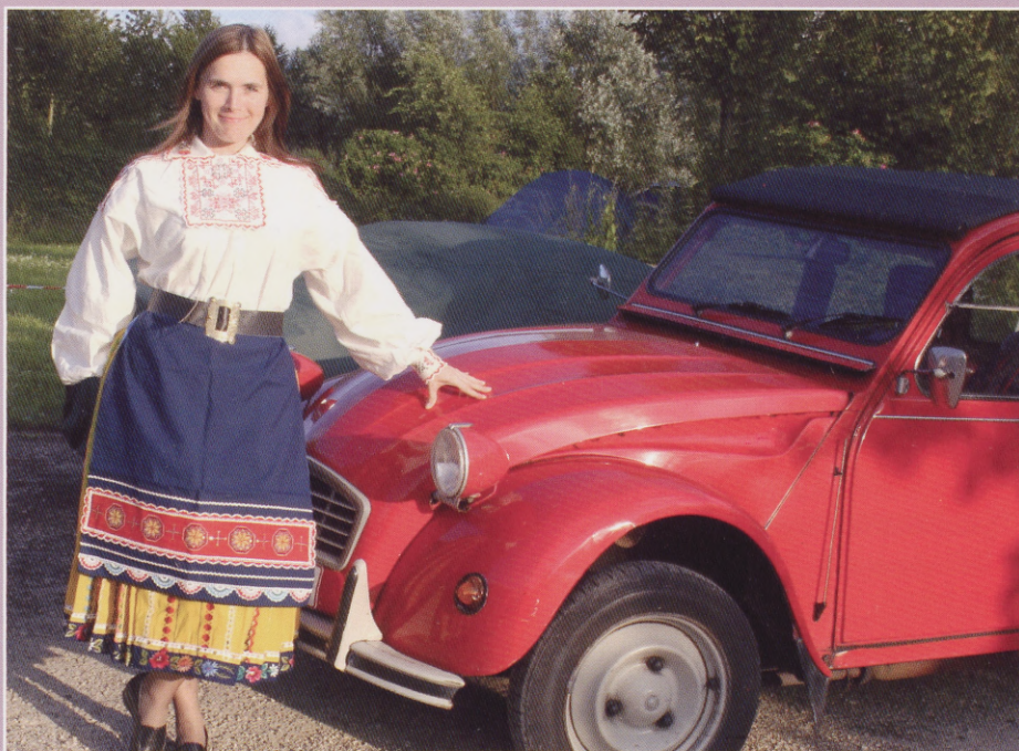
Maive eestlasena Brüsseli jaanitulel.

Eesti ettevõtjad on uuendusmeelsed, pea pooled on viimaste uuringute andmetel hiljuti uuendanud või täiustanud oma protsesse ja tooteid, ületades isegi Euroopa keskmist taset. Eesti ettevõtjad investeerivad innukalt info- ja kommunikatsiooni tehnoloogiatesse, nagu ka masinatesse ja seadmetesse, teenindussektori firmad on varmad oma tooteid uutele vajadustele kohandama. Samas jääb nõrgaks teadus- ja arendustegevuse investeeringute tase, kõrgetehnoloogia sektorite osakaal majanduses on jätkuvalt madal, eksport jääb impordile alla.