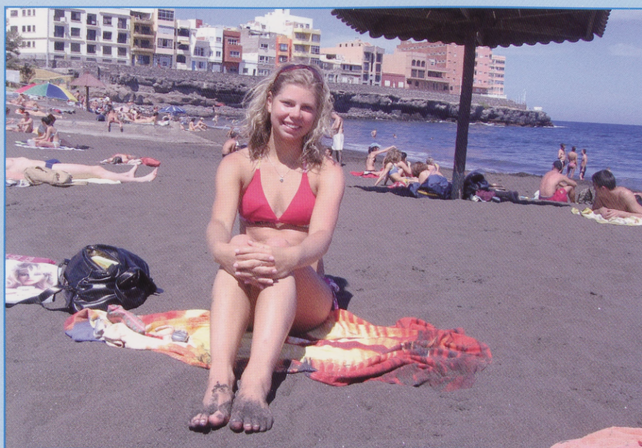
Praktika kuuma päikese all.