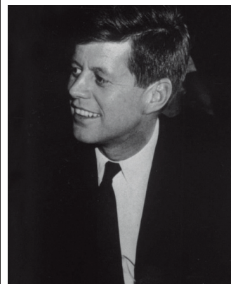
John F. Kennedy