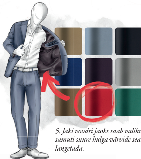
5. Jaki voodri jaoks saab valiku samuti suure hulga värvide seast langetada.