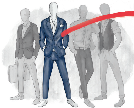
1. Jakk (hind alates 375 eurost), ülikond (hind alates 495 eurost), püksid (hind alates 145 eurost), vest (hind alates 125 eurost).

J.P. Club on kõrgklassi eksklusiivne ateljee nahast mööbli, peente seinapaneelide, disainitud vidinate ja kallite maalidega, kust härrasmehed leiavad endale kõik eluks vajaliku alates saabastest kuni soovitud mõõtude järgi valmistatud kottideni. Projekti algataja on Diego Della Valle, ettevõtte Tod's president, ning ateljeed asuvad Milanos (sarja esimene, avatud eelmise aasta juunis), Pariisis, Shanghais, Tokyos ja Los Angeleses (avatud selle aasta märtsis). Siin, rüübates mõnd kvaliteetset keelekastet, võib valida ja tellida kotte ja kingi, mida kaunistab ajalooline logo J.P. Tod's. Esemad on seeriast Sartorial Touch, mis on juba põlvkondi kestnud käsitööskustega loodud, ning nende nahanumbrid ja värvid ulatuvad ühest äärmusest teise. Tellimustööde valmimise aeg on umbes kaks kuud, hinnad alates 1000 eurost kingade puhul ja 2500 eurost kottidel. www.tod's.com