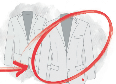
3. Mugava lõikega, kitsa, ühe- või kahekordse reaga, taskute ja nööpide arv, tagumine või külgmised lõhikud. Kogu ülesehitus ad hoc.