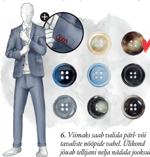
6. Viimaks saab valida pärl- või tavaliste nööpide vahel. Ülikond jõuab tellijani nelja nädala jooksul.