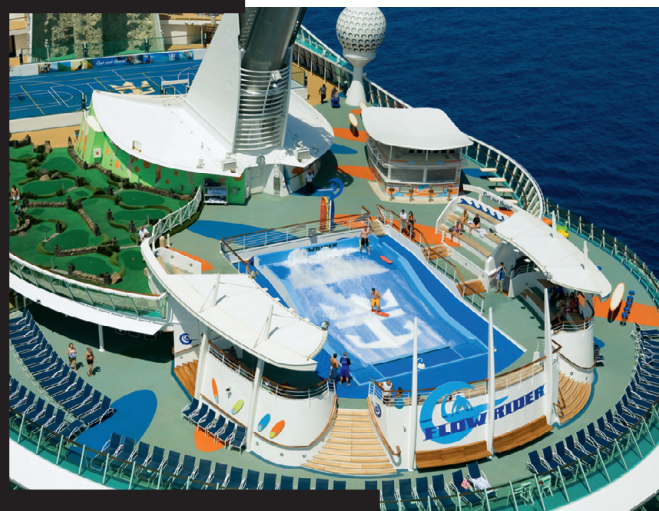
Ülal: Royal Caribbeani Serenade of the Seas. Kõigile, kes laevas elavad ja puhkust veedavad, on meelelahutus elementaarne. Üleval paremal: vaade laeva Liberty of the Seas tekile. Paremal: Independence of the Seasi teatrisaal.