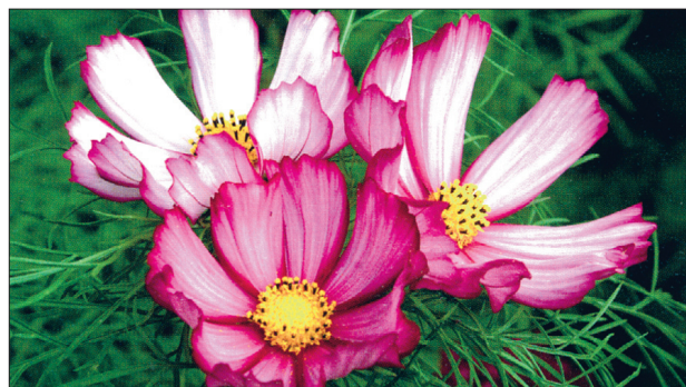
'Candy Stripe' .