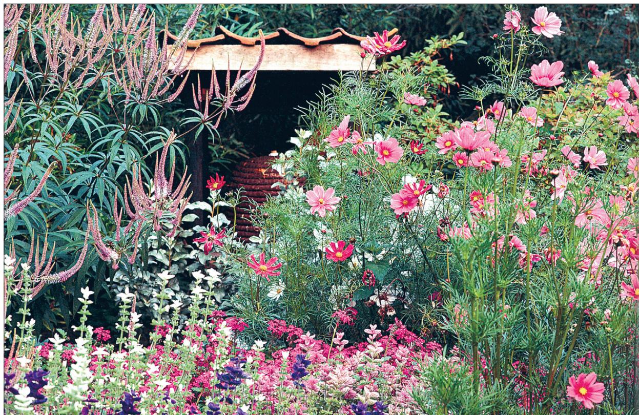
Toon toonis lillerühm: virgiinia männasmalane, harilik kosmos ja kirju salvei.