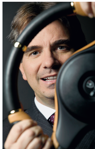
Furlan töötab Momos tegevjuhina, seejärel asus tööle Fiat Gruppi.

Rool on auto juures küll funktsionaalne detail, kuid see on parim element, mida käsitöö abil kaunistada. “Siin saame kasutada selliseid materjale, mis seeriatootmises oleksid mõeldamatud – nagu näiteks aniliiniga pargitud nahk või lakkimata tiikpuust lisandid. Need on elavad ja soojad materjalid, mille välimus ajapikku täiustub.” Materjalide hulgas,