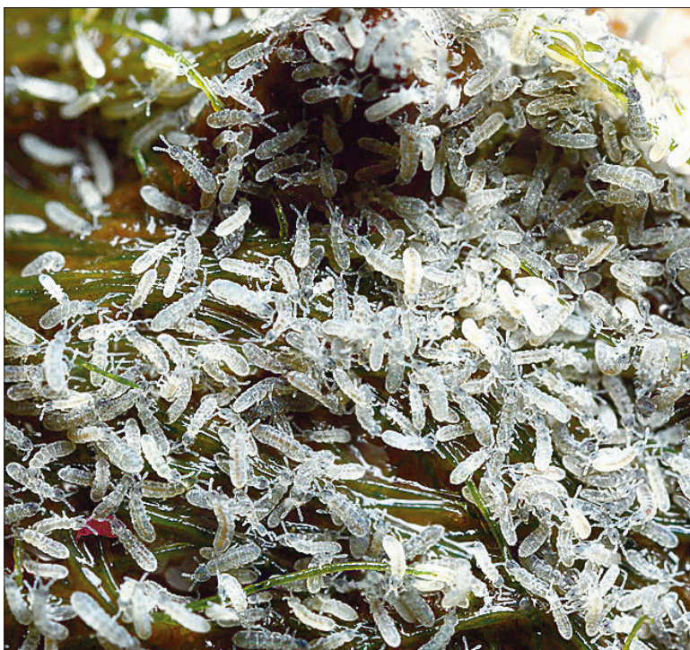
Hooghännad kahjustavad taimi vaid siis, kui neid on massiliselt.