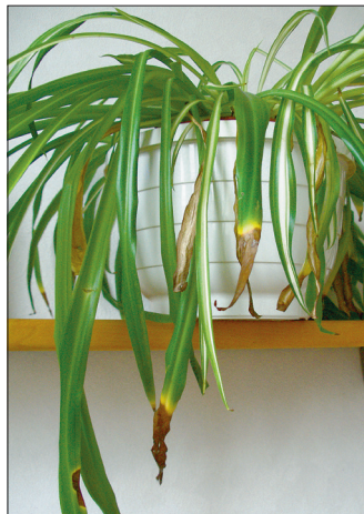
Tups-rohtliilia pruunistunud lehetipud kõnelevad liiga kuivast õhust või vähesest kastmisest.

■ Villitaolised läbipaistvad, teravalt piiritletud plekid, osalt korgistunud: piserdatud ereda päikese käes.