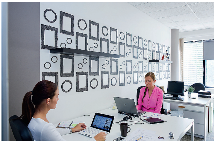
↑ Igal töötoal on oma väike teema – selle ruumi pilgupüüdjaks on horisontaalselt seina paigutatud tühjade pildiraamidega tapet.

← Otse keset kontorit asub rahulikes toonides elutuba, mis toob tihedaid toimetamisi täis päeva mõnusat lõõgastust.