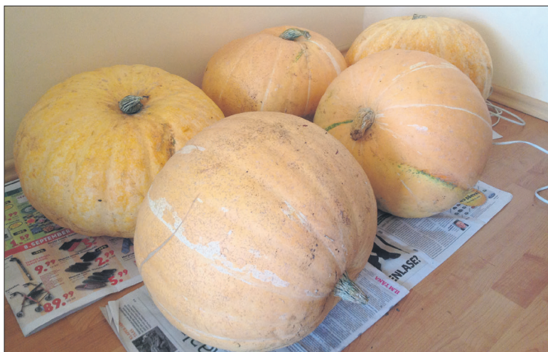
Osa kõrvitsatest, mis kasvasid taimejäänustest rajatud peenral.

umbrohtunud maad kaevamata ning hiljem ka peenart rohimata. Sügisel peenrakatet eemaldades oli näha, et suurem osa eelmisel suvel kokku tassitud umbrohist oli kõdunenud ja äratuntava kuju olid säilitanud vaid puitunud varred.