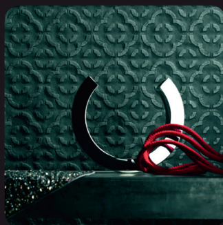
▲ RELJEEFNE TAPEET – disainer Ulf-Moritz, tootja Marburg – efektne reljeefne tapeet