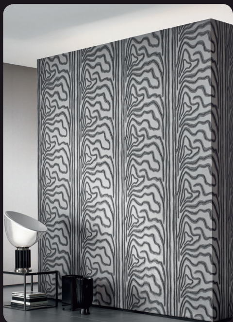
◀ PEALE ÕMMELDUD TÜLLIGA MOIRÉ MUSTRI IMITATSIOONIGA TAPEET – tootja Sahco ja disainija Sahco disainerite meeskond – üks eksklusiivsemaid aplikatsioonidega tapeete