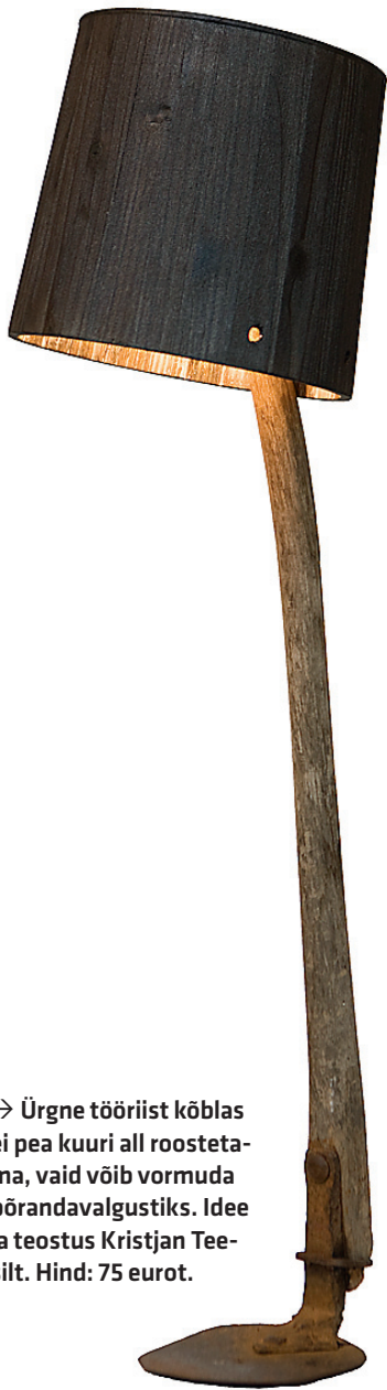
→ Ürgne tööriist kõblas ei pea kuuri all roostetama, vaid võib vormuda põrandavalgustiks. Idee ja teostus Kristjan Teesilt. Hind: 75 eurot.