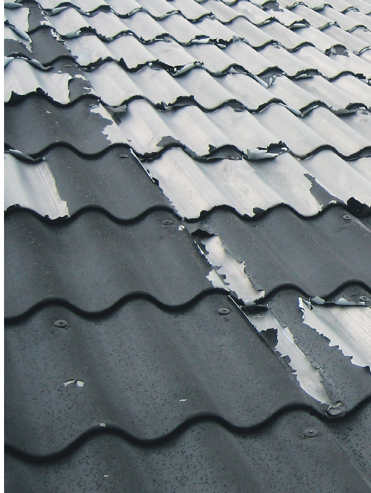
KADRI TAMM kaasaautor

20 aasta tagune praak viib metallkatuste mainet teenimatult alla - kooruva pvc-kattega materjali meil üldiselt enam ei müüda, ent 1990ndate aastate praagiga maadeldakse just nüüd.