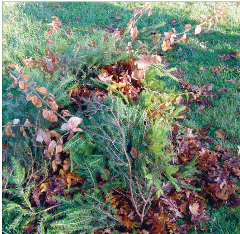
Liiga varakult vihmasel ja soojal ajal pandud lehtedest talvekate vettib ega paku enam kaitset.

Talviste sulailmadega aga surevad sellise katte all taimed lämbumise tõttu.