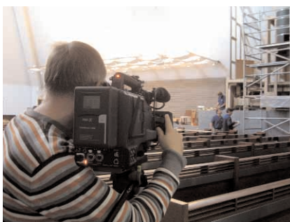
Orelihituse olulised hetked jäädvustati ajaloo tarbeks ka liikuva pildina. Ehk valmib neist materjalidest kunagi ka film.

lik vaikus, aga et ka koguduse elu päriselt ei seiskuks, kes mõtles läbi oreli pühitsemise talituse ja pani paika jumalateenistuse, kes valis välja esimesel kontserdil esitatavad palad ja leppis kokku esitajad, kes koostas ja teostas näituse, kavalehed, orelifondi bukleti, kes kirjutas ja saatis laiali kutsed ning valmistas ette tänukirjad, kes tellis kringlid ja kes kattis laua õhtuseks ametlikuks vastuvõtuks, kes lihvis oma sõnavõtu teksti, kes kandis hoolt selle eest, et toimuvast talletuks visuaalne jälg, millest unistuste täitumise korral õnnestuks ehk