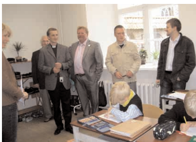
Kirikuvalitsuse liikmed toomkoolis tunnis.