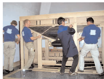
26. september: orel kerkib silmanähtavalt.