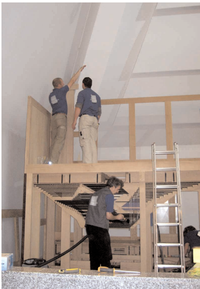
Oreliehituse seis 26. septembri keskpäevaks.