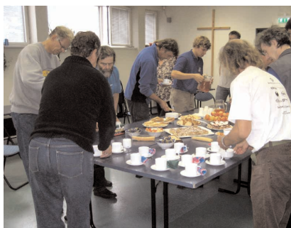
26. septembri talgulised keskpäeval kohvilauas.