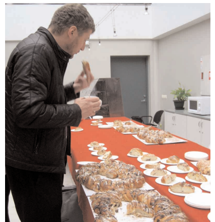
Pidupäevale kohaselt pakuti 30. oktoobril kõigile kirikulistele kringlit.

Pärast teenistust pakuti kiriku aatriumi poolel kõigile kirikulistele kringlit ja kohvi ning kirjutati üldise melu taustal pidulikult alla oreli ülevõtmise-vastuvõtmise aktile. SA Hugo Lepnurme nimelise Orelifondi ehk tellija nimel tegi seda juhatus