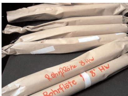
Iga orelivile oli Tallinna saatmiseks hoolsalt pakitud.