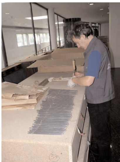
Ja pakiti sama hoolsalt ka lahti.

Algul mitte nii väga suurena ja va-hepeal lausa põhjatuna tundunud rekka sai tühjaks ligikaudu keskpäevaks. Ja vähemasti allakirjutanu jaoks ootamatult kiiresti oli selleks ajaks kirikusaalis kerkimas juba ore-li “karkass”.