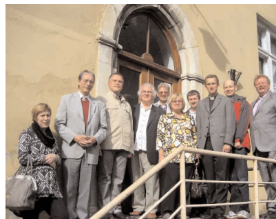
Apteegi tänavalt lahkudes kogunes kirikuvalitsus ka ühispiletile.