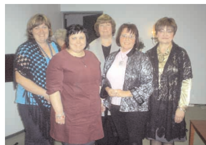
EMK Naiste Ühenduse juhatus.