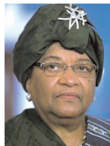
Libeeria president Ellen Johnson-Sirleaf.

hupreemia kolmeks võrdseks osaks ja pärjata sellega kolm inimest: Ellen Johnson Sirleaf, Leymah Gbowee ja Tawakkul Karman said Nobeli rahupreemia oma vägivaldatu võitluse eest naiste turvalisuse ning õiguse eest osaleda rahu ülesehitamises. Nobeli komitee väitis otsust põhjendades, et maailmas ei ole võimalik saavutada demokraatiat ning kestvat rahu, kuni naistel pole ühiskonna arengu mõjutamisel samu võimalusi kui meestel.