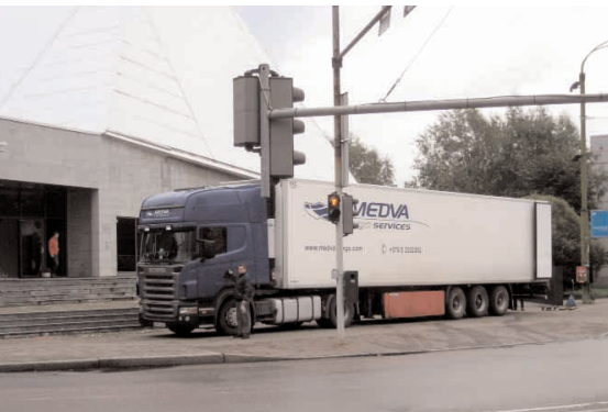
Orelit täis rekka 26. septembril Tallinna metodisti kiriku ees.

Ususõbrad on olnud kui sipelgate vägi, kes on siblinud ja töötanud selle nimel, et oleks orel. On olnud suurannetajaid ja väikeannetajaid, kes on kümne euro ja krooni kaupa pannud oma piskut kokku. Tänu Jumalale selle eest. Olgu õnnistus igaühega, kes on jaganud ja andnud.