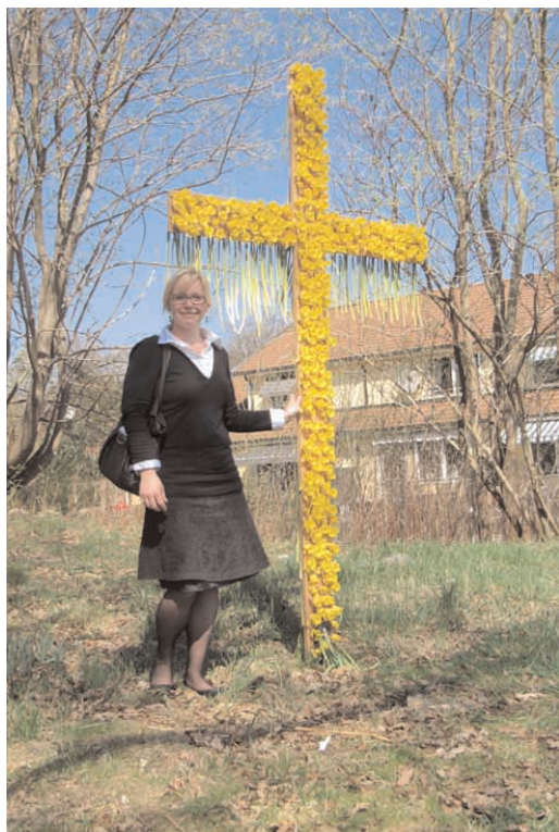
Elus nartsissidega kaunistatud rist ülestõusmispüha hommikul Gothenburgis.

Olen tänulik selle aja eest koos toredate kristlastega, kes armastavad Jumalat ja on valmis tegema võimatust võimaliku, et teenida lapsi ja kuulutada Kristust. Isiklikult sain juurde julgust näha asju suuremalt ja kogemuse veeta aega koos tõeliselt siira ja armsa puudega poisiga, kelle silmist kiirgas armastust ja rõõmu, kuid kelle füüsilist olekut vaadates meenus iga kord kannatav Kristus. Ta tegi seda minu eest! KT