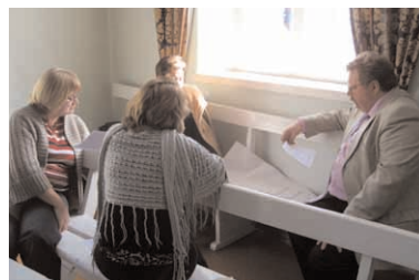
Rakenduskava töögrupi kohtumine 16. märtsil Paides. KT

legaadid 2012. aasta peakonverentsile eelseisval aastakonverentsil. KT