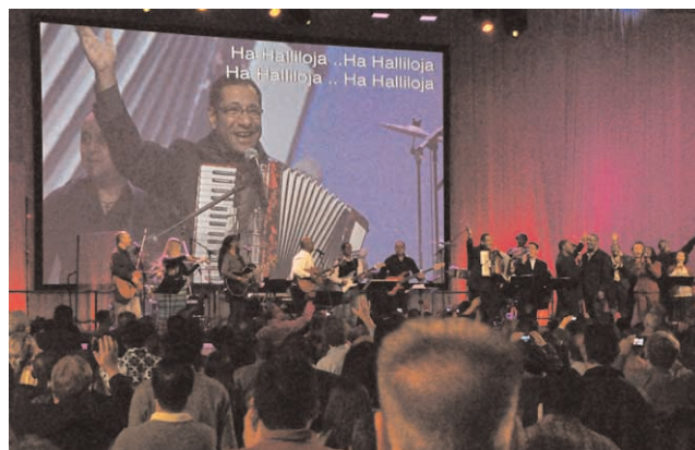
Laulujuht Egiptusest näitas, et araabia keel, nagu kõik muud keeled, kuulub Jumalale.

Arvan, et mulle avaldas sügavaimat muljet egiptlasest ülistusjuht. Üldiselt seostame me araabia keelt islamiga. Aga araabia keel ei ole Muhammadi keel – araabia keel, nagu kõik muud keeled, kuulub Jumalale.