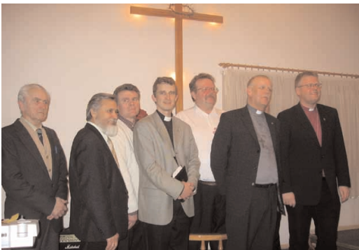
Ida-Virumaa pastoritega Jõhvis.