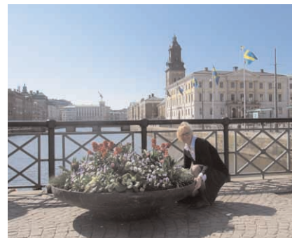
Gothenburgis kevadet otsimas.