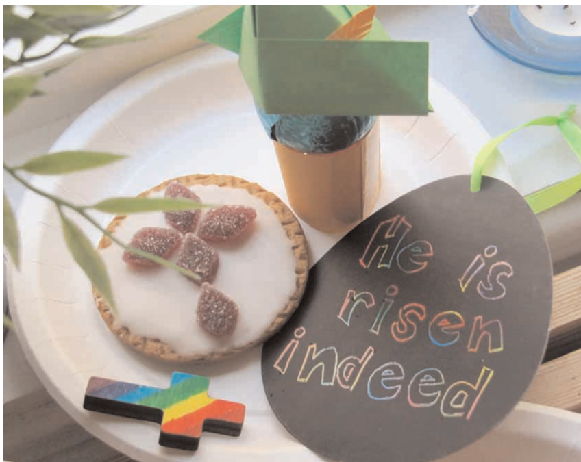
Ideed Inglismaalt, mida igäüks sai ise läbi proovida.

Kahtlesin pikka aega, kas seekordne SwopShop on ikka minu jaoks. Kui kõik teised olid loobunud,