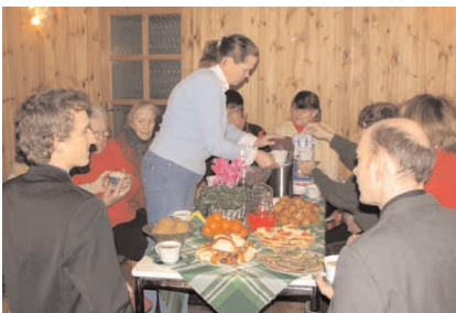
Kärsa kogudus kahekümnenda sünnipäeva osades.