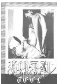
Esimene taasilumisaegne KODUTEEL ilmus mais 1990.