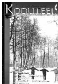
Kahekümne viies KODUTEEL ilmus 1996. aasta kuuenda numbrina.