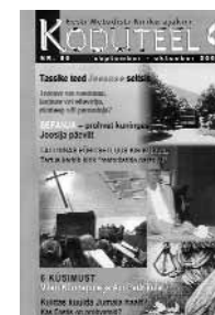
Viiekümnes KODUTEEL ilmus 2000. aasta viienda numbrina.