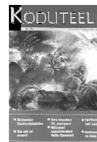
Seitsmekümne viies KODUTEEL ilmus 2004. aasta kuuenda numbrina.