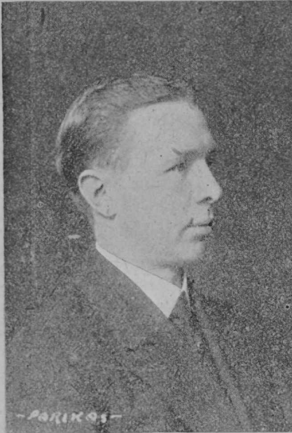
Eesti Skautide isa Anton Öunapuu. †