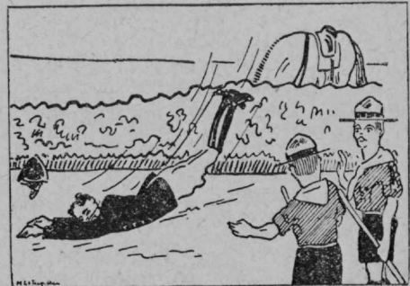
Algaja: Nähtawasti huvitab ka ratsanikku lennuasjandus.