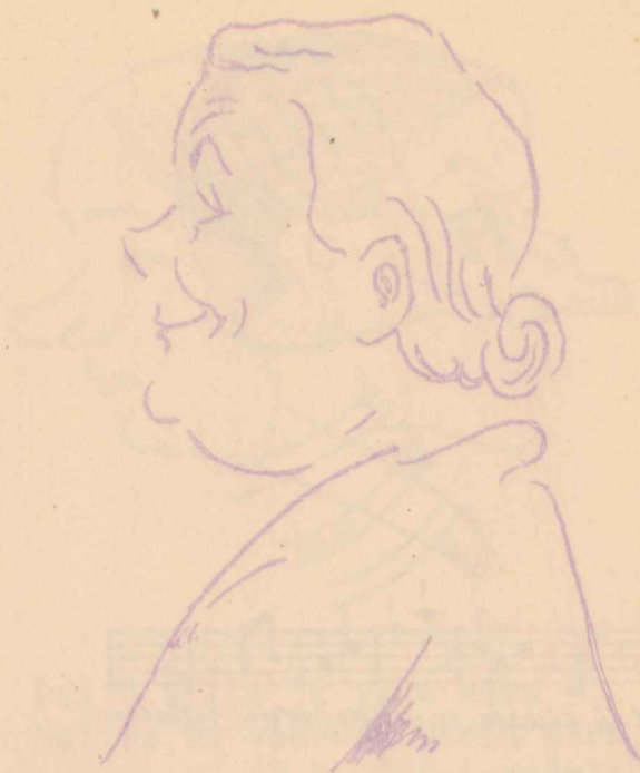
Portreid meie klassi kaelukamast rahvast.