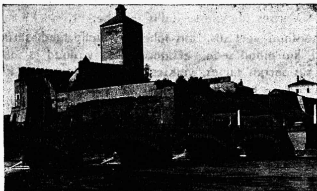
Hermanni kindlus ja puusild.