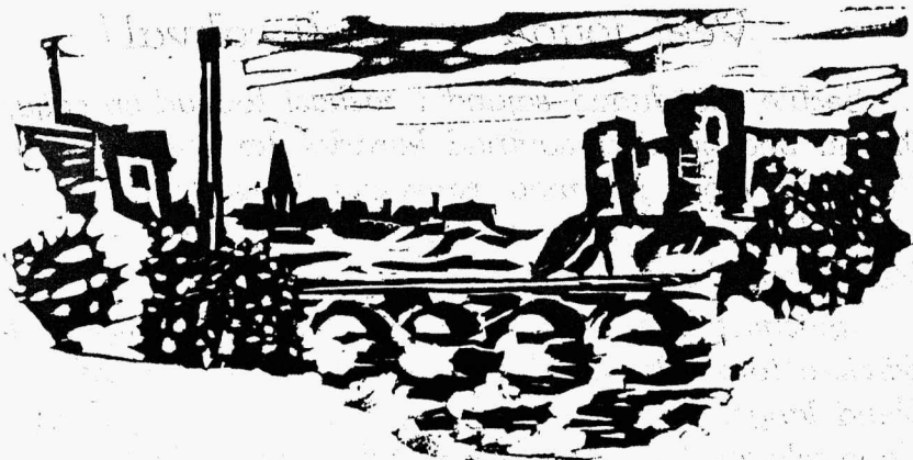
Vaade Narva kindlustele.