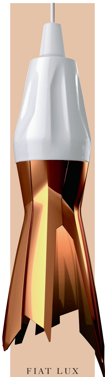
FIAT LUX Uus valgusajastu

Erinevate stiilidega eksperimenteerimine on riskantne, aga kui see toimib, toimib see sajaprotsendiliselt. Peugeot Design Lab, automargi loovlaboratoorium esitles Milano mööblimeessil lambikollektsiooni Onyx. Erinevaid liike on kollektsioonis kolm: ühed on 3D-prinditud (ülal pildil) ning mängivad nii värvide kui ka vormidega, teised kasutavad maksimaalselt ära vanapaberit, et luua puiduast hõngu, kolmandad on pea kolmemeetrise laiusega laelambid, mis on loodud ühest tükist puidust otse Filipiinidelt ning varustatud 3D-detailidega. peugeotdesignlab.com