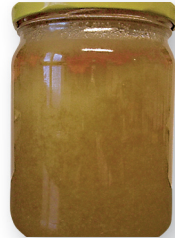
Sulatatud mesi hakkab tasapisi kristalliseeruma: glükoosikristallid on erineva suurusega, meekristallide jaotumine on ebaühtlane.