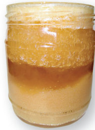
Anumas on eri aegadel vurritatud mesi: anuma põhjas olnud kristalliseerunud meele lisati vedel "toores" mesi, mida omavahel ei segatud. Toores" mees algas käärimine ja see levis kristalliseerunud mette.