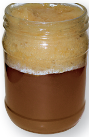
Õiemesi on vedel, kuid vahutab, s.t. käärib. Mesi võeti meekärgedest liiga vara välja ja on "toores".