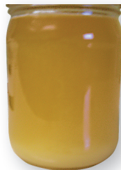
Kristalliseerumise algstaadiumis on õiemesi hägune.