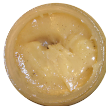
Roosteosakesed. Loodan siiralt, et sellist pilti enam ei näe.