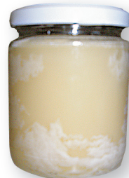
Ühtlaselt kristalliseerunud glükoosirikas mesi.