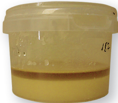
Mesi on soojendatud ja siis seisma jäänud. Kuna fruktoosikiht on õhuke, on tegemist õiemeeaga.