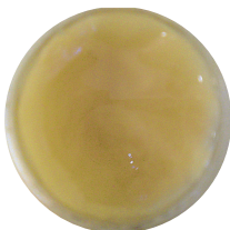
Kreemjas mesi (ka vahustatud mesi, võidemesi). Mee segamisel tõuseb niiskus ülemistesse kihtidesse. Kui "järelkuivamist" ei toimu, läheb selline mesi käärima (kui õigel ajal jaole saada, võib mee veel päästa).