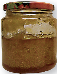
Kanarbikumes toimuv käärimine.