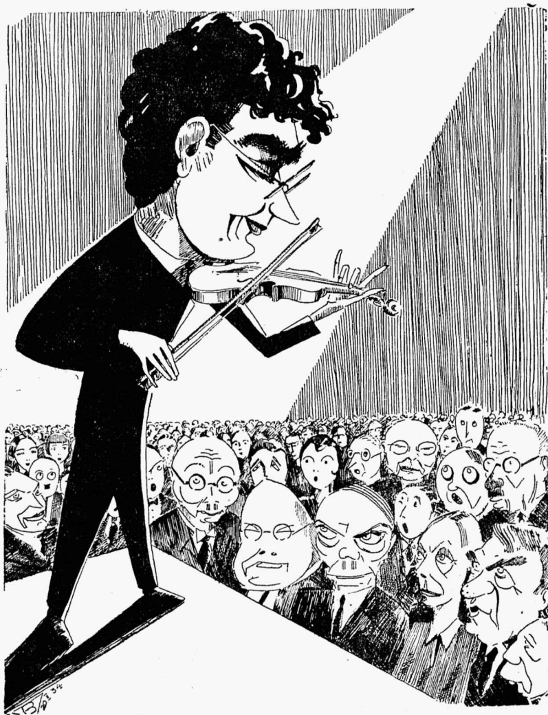
T. P. G. »Paganini«.

tudki. Ta teadmiste-kvantum, millega pidi tuleviku ellu astuma kui hästiteritatud relvadega, suurenes tiguaeglaselt. Juba pandi seda