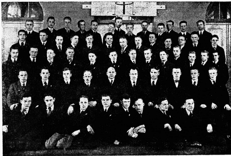
T. P. G. abiturientid 1934. a.

Tulnud algkoolist, täis enesega rahulolutunnet ja teadmist, et teda usutakse ja hinnatakse juba esi-mesest pilgust — pettus ta kesk-