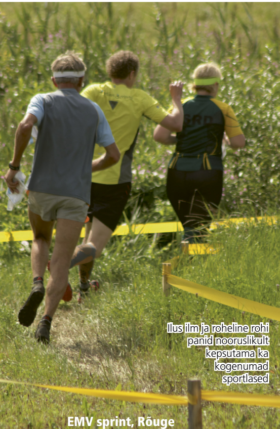
Ilus ilm ja roheline rohi panid nooruslikult kepsutama ka kogenumad sportlased