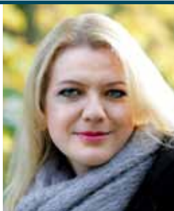
Aile Asszonyi

Tellimine: AS Express Post Maakri 23A, 10145 Tallinn Tel 617 7717, www.tellimine.ee Tellimisindeks 00679 Otsekorraldus 23 krooni number Aastatellimus 305 krooni Muusikaõpetajatele ja -õpilastele aastatellimuse soodushind 215 krooni. Soodushind kehtib ka pensionil olevatele muusikaõpetajatele. Tellimine: ia@ema.edu.ee, herje@ema.edu.ee, 6675 788, 55 56 18 94