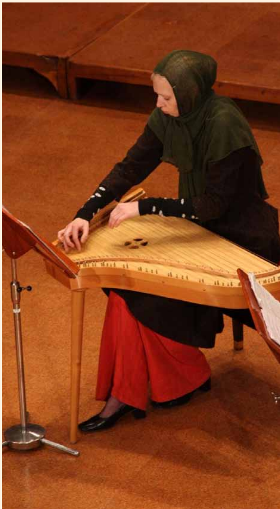
Kromaatileine kannel kõlamas artikli autori käe all Iraanis.

maal gusli . Neis maades on olemas ka kromaatiliste võimalustega kontsertinstrumentid, mis kõik üksteisest erinevad. Läti, Leedu ja Soome “kontsertkannedel” saadakse pooltoone diatoonilisele helireale lisatud mehhanismide abil (sarnaselt harfiga). Eesti kandel on ainsana kromaatilised helid keeltena olemas. Mitmete erinevuste kõrval (kõla, ulatus, osaliselt mänguviis) on meil siiski ka palju ühist.