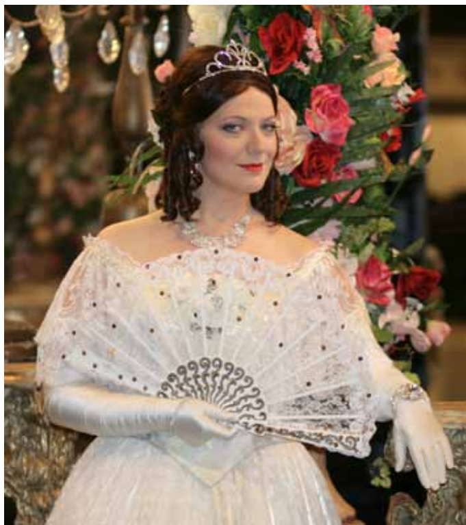
Violetta rollis Verdi "La traviatas".