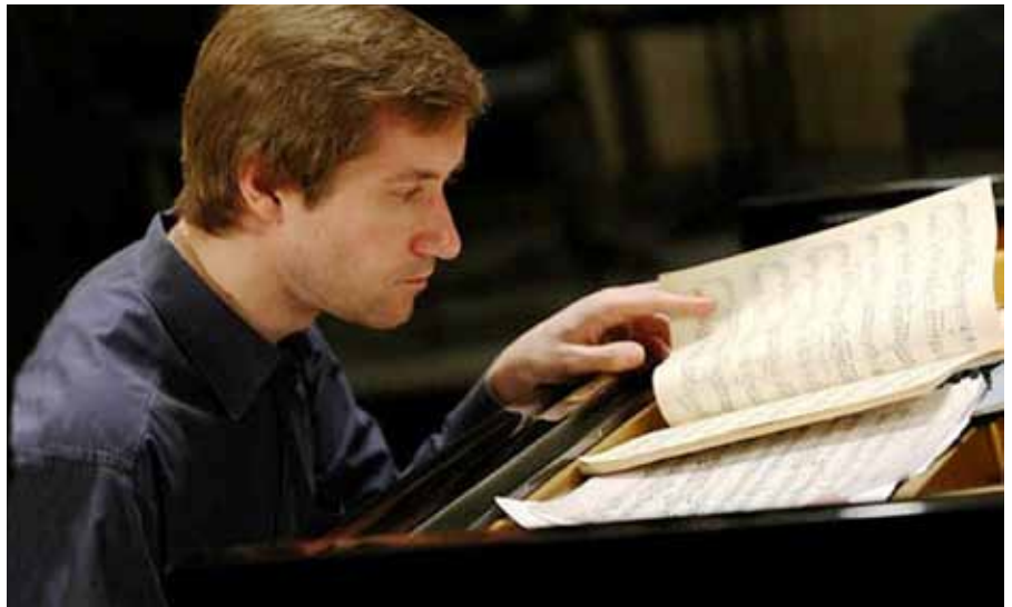
Nikolai Luganski proovis Krasnojarski Filharmoonias.

“Kunsti imega ei ole võimalik harjuda” – need legendaarse Heinrich Neuhausi sõnad meenusid mulle Luganski klaveriõhtul festivalil “Klaver ‘04” ja ka hiljuti selle aasta aprillis, kui Nikolai Luganski esitas Soome raadio orkestriga Sakari Oramo juhatusel Rahmaninovi Neljandat kontserti. See helilooja sõnul “pöörane” muusika, mis on täis traagilist üksindust, talumatut igatsust ja valu, haaras oma siirusega. Nikolai Medtner on öelnud: “Temas tunne mõtleb, aga mõte tunneb.” See ongi kõige olulisem Rahmaninovi, ja Luganski suutis selle edasi anda. Mulle tundub, et nende sõnadega võib iseloomustada ka Luganski enda mängu, sellepärast on talle ka Rahmaninovi muusika lähedane. Enne kontserti õnnestus mul pianistiga vestelda.