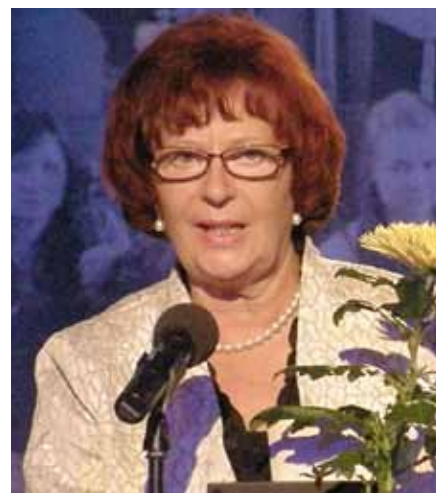
Eesti jazzi grand lady Anne Erm.