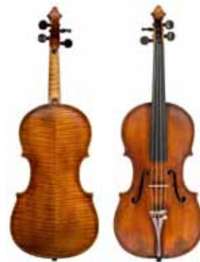
Napoleonile kuulunud Stradivari viiul kannab nime "Molitor".

Viiul kannab nime "Molitor" ja see on val-