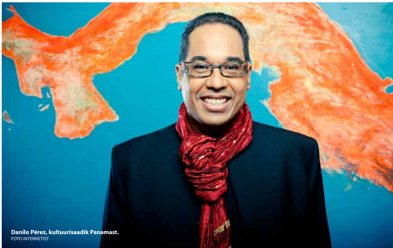
Danilo Pérez, kultuurisaadik Panamast.