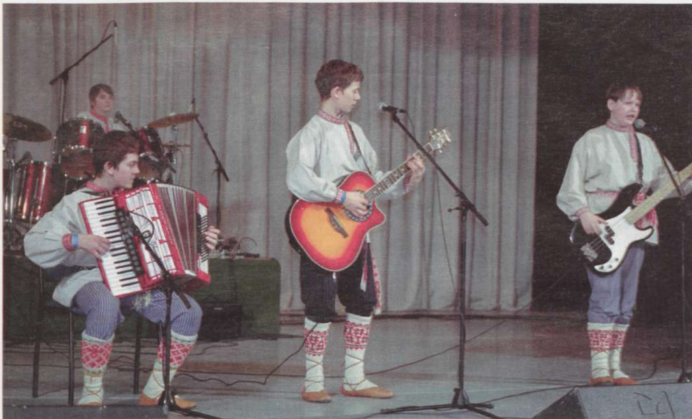
"Teemi seto punkki," teatasid kootud põlvikutega Värskas poisid ansamblist Zetod.