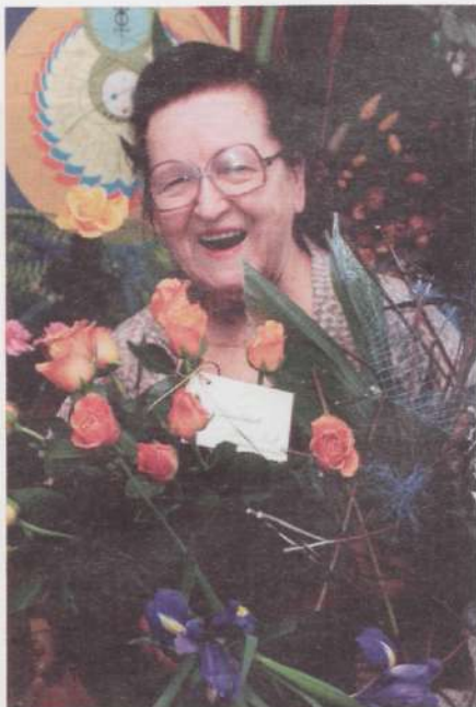
Värvilised ja lõhnavad õnnitlused.