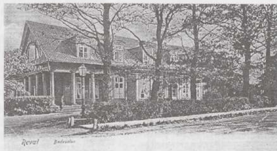
Sajandialguse suvitajate meelispaik Kadrioru Supelsalong.