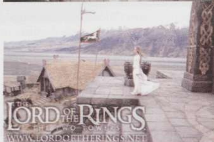
Oscarite tseremoonial arvukalt mehikesi rõõvinud “Sõrmuste isand” vormitakse varsti muusikaliks.