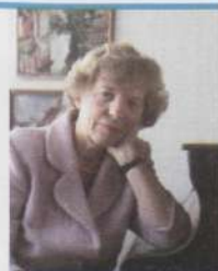
LILIAN SEMPER

Tellimine OÜ Kirilind tel (0) 640 85 97, (0) 640 85 99 faks (0) 640 85 98 e-post: kirilind@estpak.ee kodulehekülg: www.kirilind.ee Tellimisindeks 00679 Otsekorraldus 21 krooni number 3 numbrit 63 krooni 6 numbrit 126 krooni Aastatellimus (11 numbrit) 230 krooni. Välismaale tellimisel lisandub postikulu.