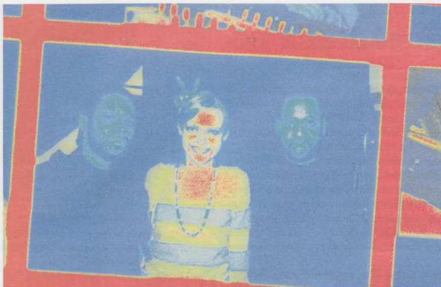
Auxmen tegeleb situatsiooni modelleerimisega, kirjeldab hetke eepiliselt ja evib nii ulmelise peace-unity ususekti kui üksinduse kultuuri mootoreid.