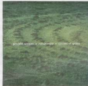
Rohuringid. Circles of grass. Projekt Unison. MKDK CD0013

Selleks, et nii kentsakast plaadist õiget pilti anda, peab ära jutustama ka plaadi saamisloot, et asi tunduks ilmekam, mõjuvam ja mõistetavam. Muusikalisele materjalile on plaadi lõpus boonusträkinä ka video, mis üritusest samuti aimu annab. Mingid tüübid otsustavad muru maast üles võtta, rullides selle lõpuks ribadena kokku nagu vaiba. Loomulikult kasutatakse muru kangutamisel ka abivahendeid. Vaibastunud murukate leiab endale uue funktsiooni pörandakattena MKDK studios alias Polümeeri mänguloomade karvastamise tsehhis (! kui ma olin nüüd nimetusega täpne). Pisut puurimist, ning tehasestudios valmivad esimesed omaloodud "keelpillid", mille poognaga tõmmates saab tekitada metalseid kriipeid. Lisanduvad ka ontlikuma helimaailma elemendid, flööti, kannel, kitarr ning idamaised pillid. Asjasse sekkuvad ka linnu- ja muud loodushäälid. Võib-olla veel keegi. Seda võib tinglikult muusikaks nimetada, ehkki pigem on tulemuseks helikeskkond koos olematute, olemasolevate ja oma-