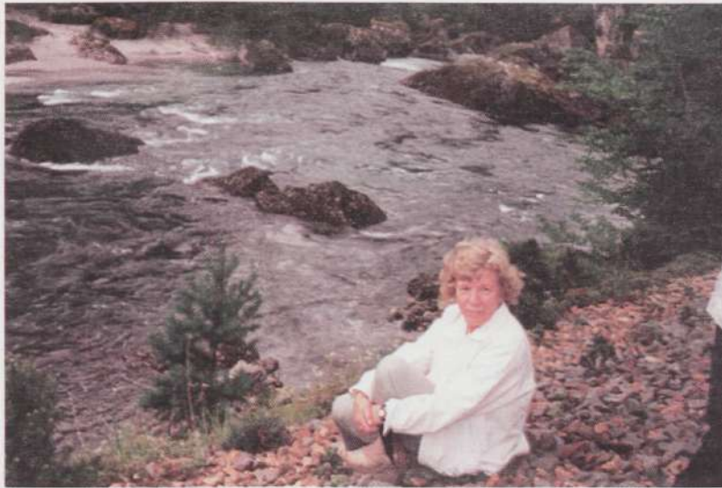
Norra. Tabatud hetk eluvoolus.

Ja veel üks viimasel ajal tõsiselt sügavat