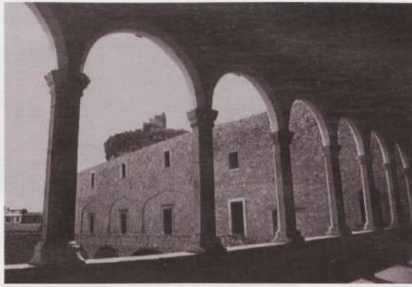
Venosa vaated.

depuhangute kohale vähem või rohkem kristalliseerunud pöörise; ja häältevaheline fantastiline kontrapunkt lisab kõnele üllatava seesmise dünaamika.”