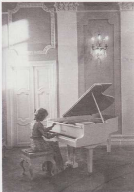
Valguse ja heli meditatiivne koosus.

Ega ma ennast algul Moskvas kuigi hästi ei tundnud. Kartsin