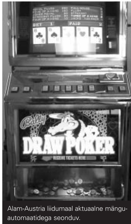
Alam-Austria liidumaal aktuaalne mänguautomaatidega seonduv.