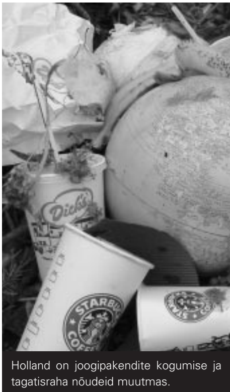
Holland on joogipakendite kogumise ja tagatisraha nõudeid muutmas.