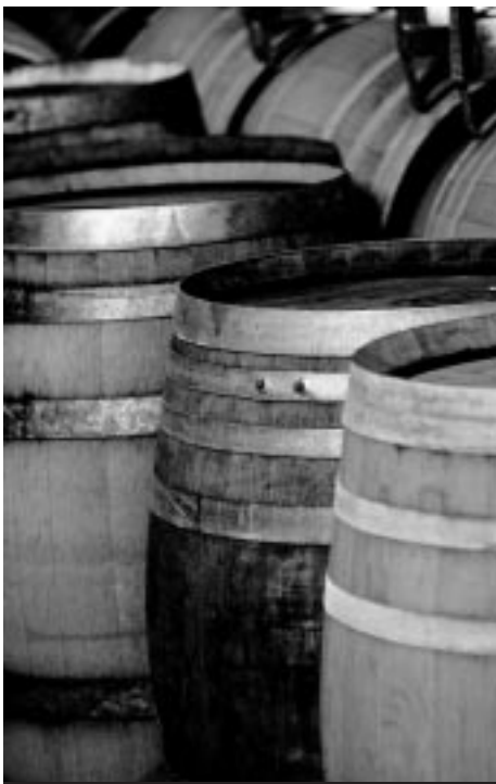
Puidust pakkematerjalide hulka kuuluvad: pakkekastid, salved, vaadid, puitalused, tugipostid, aluspuud jne.

P akkematerjal peab olema läbinud kas kuumtöötlemise või olema töödeldud metüülbromiidiga. Pakkematerjalile peab olema kantud töötlemistviisi tõendav vastavusmärk. Märgistusega puitalused ja puittaara kuulub hävitamisele või tagasisaatmisele. Allpool toodud tabel annab ülevaate riikidest, kus nimetatud standard kasutusel on.