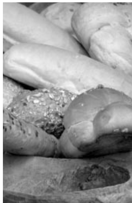
Kreeka kehtestamas nõudeid pagaritoodete tootmisele ja turustamisele.

näiteks Holland on mõningaid joogipakendite kogumise ja tagatisrahaga seonduvaid nõudeid muutmas. Nimelt on lihtsustumas näiteks väikestele müügikohtadele (müügipindala alla 200 m 2 ) esitatavad nõuded. Sellised müügikohad võivad piirata joogipakendite kogumist nii, et kogutakse ainult neid pakendeid, mis samas müügikohas kolmandale osapoolle kättesaadavaks tehakse. Selgituseks tuuakse argument, et väikestele