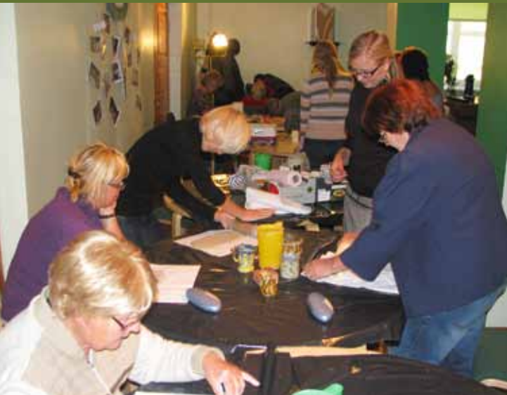
Lüllemäe rahvaõpistu keraamika õpitoas said valgamaalased näpud saviseks.