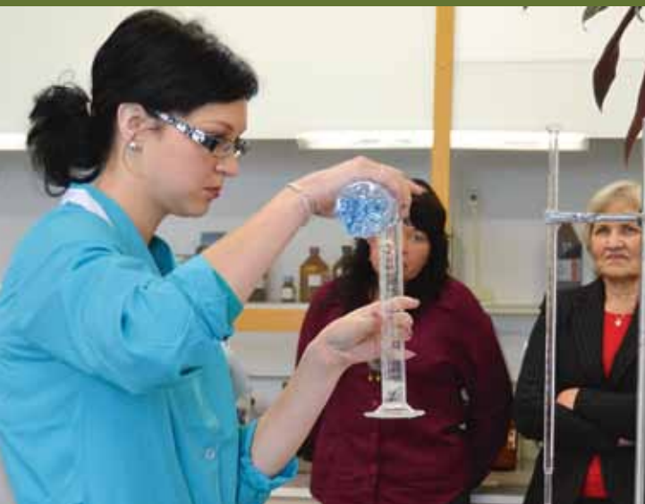
TTÜ Virumaa kolledžis õpetati kiirtestiga määrama jookide pH-d.