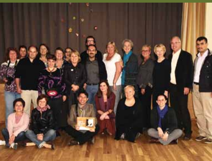
Külalised Iirimaa, Prantsusmaa, Türgist, Ungarist, Hollandist ja Sloveeniast TÖN-i avaüritusel Raplas