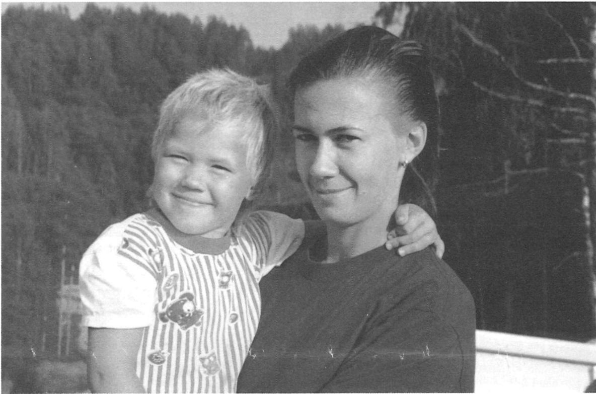
Nii käib Elo võistlustel.

See, mis kutsub tantsima. Mulle meeldib tantsida.