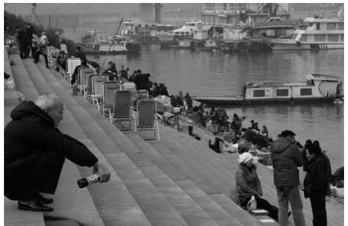
Rahvas on kogunenud Yangze jõe äärde, et pühade eel must pesu puhtaks pesta.