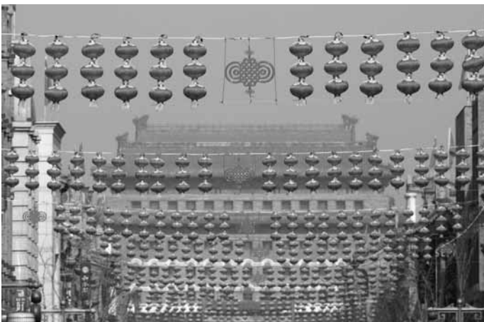
Pühade ajal on Peking laternatega kaunistatud. Wanfujing jalakäijate tänav.

baodesse . Sugulastele, sõpradele ja äripartneritele saadetakse aga korvidega apelsine või apelsinipuusid, seda just Lõuna-Hiinas. Põhja pool seda kommet ei tunta. Viljapuude kinkimine jõudis Hiina Vietnamist, kus see on äärmiselt populaarne. Viljapuude nimetus on kõlalt sarnane rikkusele. Et rikkus majja tuleks, ongi kindlam apelsinid teele saata. Apelsini ja mandariinipuude meri on ilusad silmale vaadata küll, kui möödume Sanya lilleturust, kuhu puud lugematul arvul kokku on kuhjatud ning kust neid sama väsimatult ja hoogsalt kodudesse ja asutustesse laiali viiakse.