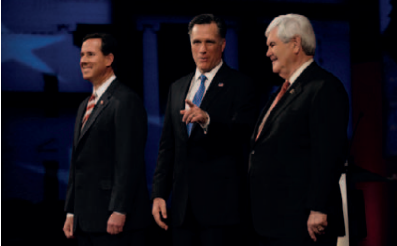
USA eelseisvate presidendivalimiste Vabariikliku Partei kolm peamist favoriiti: endine senaator Rick Santorum, endine Massachusettsi kuberner Mitt Romney ja kongressi endine esimees Newt Gingrich Tampa Bays Floridas debateerimas.

Purustatud hooned Baba Amris Süüria Homs'i provintsis, kus valitsusvägede jõhker tegevus põhjustas 2012. aasta veebruari algul tõelise humanitaarkatastroofi.