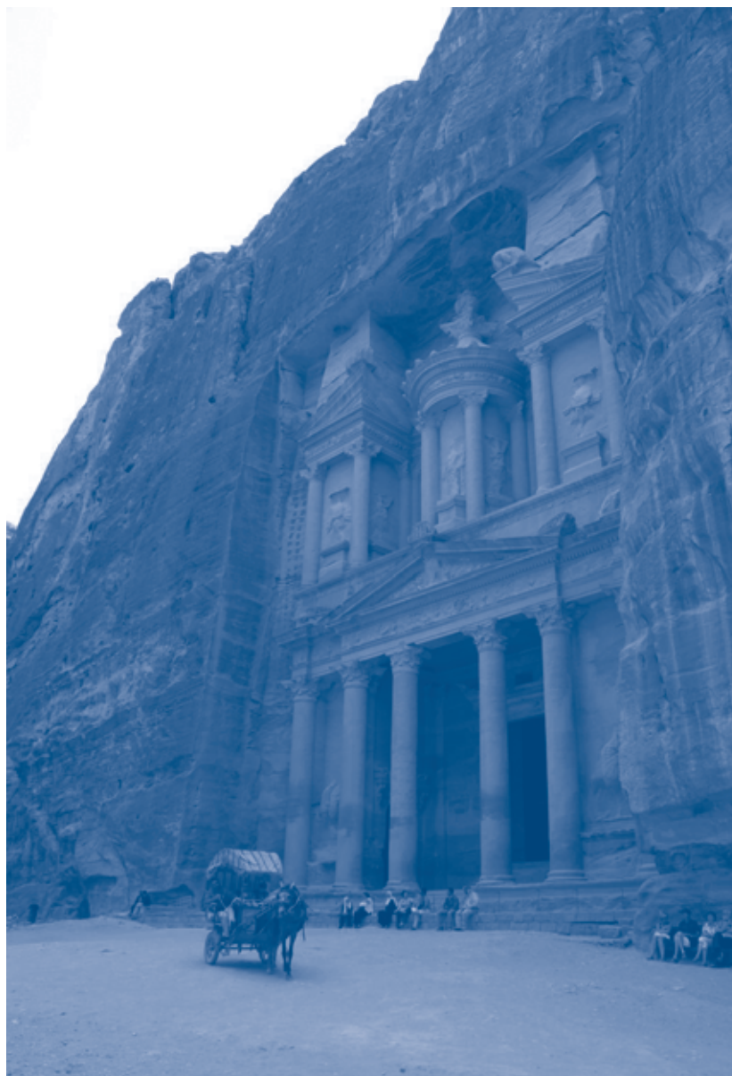
Kuulsaim vaade iidsest kaljulinnast Petrast – Al Khazneh ehk varakamber.

Suvi on Jordaania turistide saabumise aeg. Laheriikidest tullakse kuuma eest varju otsima. Siis liigub Ammani tänavatel tavapärasest rohkem eriti suuri maastureid. Poodides ja söögikohtades patseerivad saudi perekonnad – ees valges hõlstsis perekonnapea, siis kari käratsemaid lapsi ja sabas üleni mustas pereema. Aastakümneid oli Jordaania nende suverändel peatuspunkt teel läbi Süüria Liibanoni. Süüria problemaatiline olukord vähendas seda transiiditurismi 2011. aastal märgatavalt, kuid selle eest veedetakse nüüd pikemalt aega Jordaania.