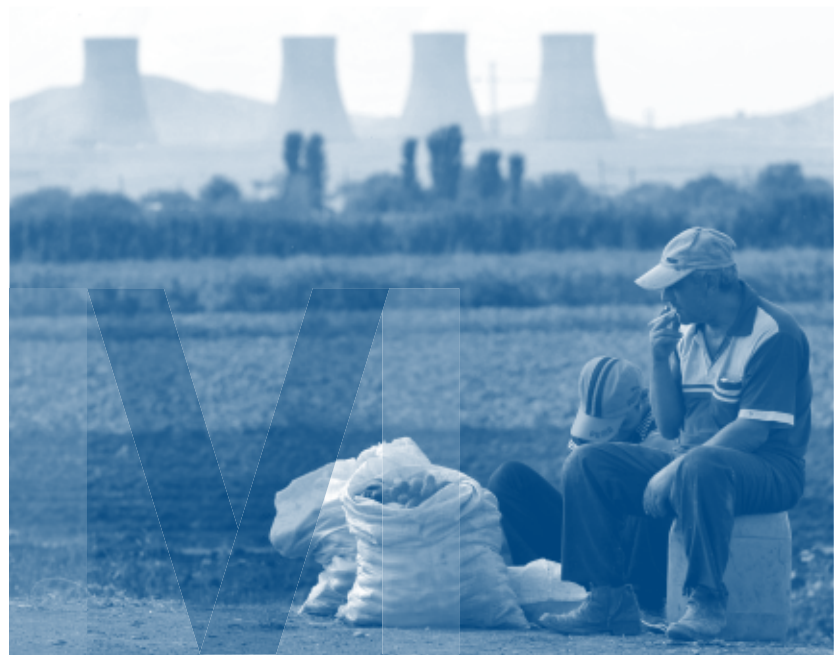
Kurgimüüja Armeenias Metzamori tuumaelektrijaama taustal. Elektrijaam asub seismiliselt aktiivses tsoonis ning kõigest 30 kilomeetri kaugusel riigi pealinnast Jerevanist (1,1 miljonit elanikku). Rahvusvaheline üldsus on juba pikka aega tagajärjetult nõudnud selle nõukogudeaegse rajatise sulgemist.

Viimastel aastatel pole riigi tasandil astutud olulisi samme armeenlaste genotsiidi küsimuses. Alustanud läbirääkimisprot-