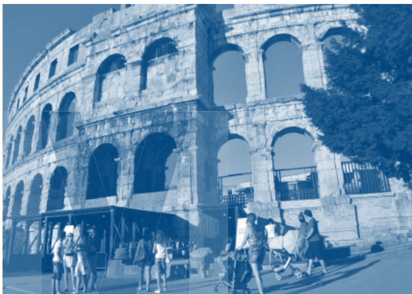
Turistid Rooma amfiteatris Horvaatias Pula linnas. Aastatel 27–68 eKr ehitatud amfiteater on üks kuuest suurimast säilinud Rooma amfiteatrist.

Mida see Horvaatia jaoks tähendab? Nagu nii mõnegi 2004. aastal ühinenud riigi puhul, saab Horvaatia jaoks ELiga ühinedes ring täis: iseseisvuse saavutamiseks oma riigi ülesehitamiseni ja sealt võrdväärseks partneriks. Oma allkirjaga tunnistavad 27 Euroopa riigijuhti, et Horvaatia on võrdne võrdsete seas. Sellega algab uus peatükk Horvaatia ajaloos. ■