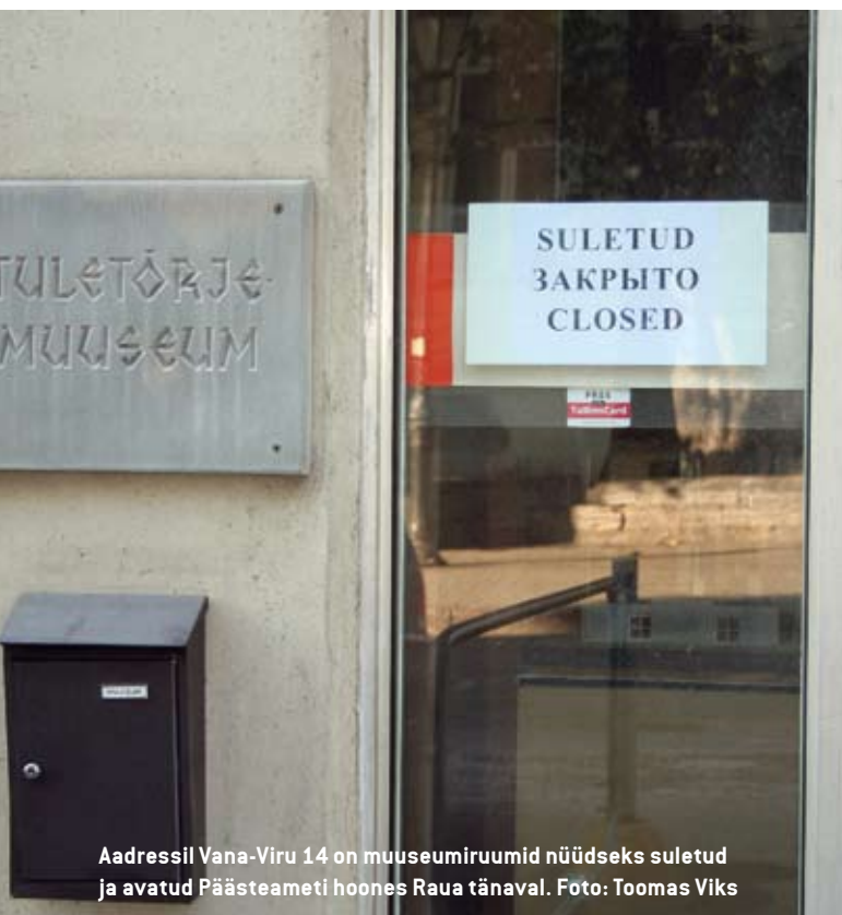
Aadressil Vana-Viru 14 on muuseumiruumid nüüdseks suletud ja avatud Päästamet'i hoones Raua tänaval.