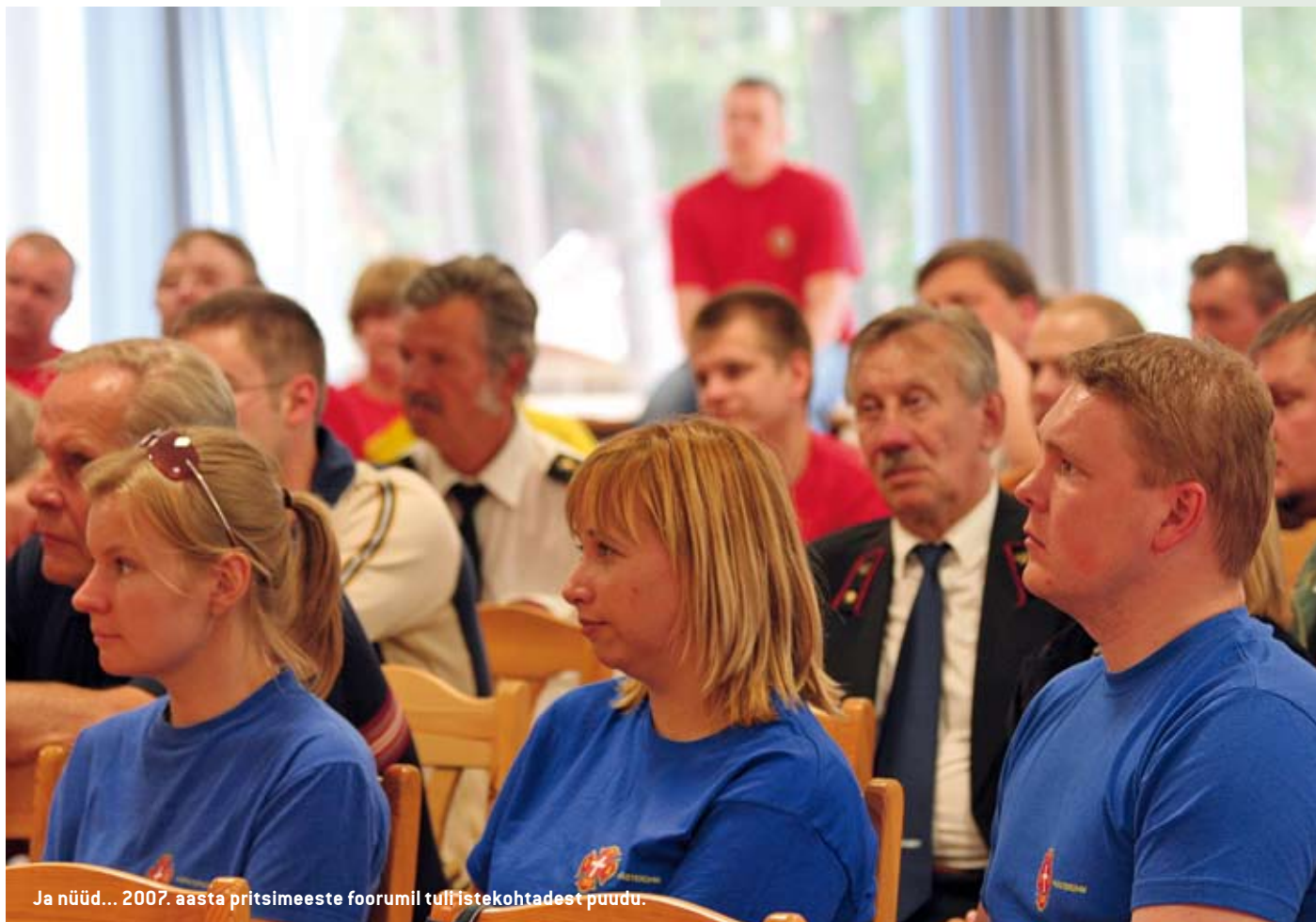
Ja nüüd... 2007. aasta pritsimeeste foorumil tulla istekohtade puudu.