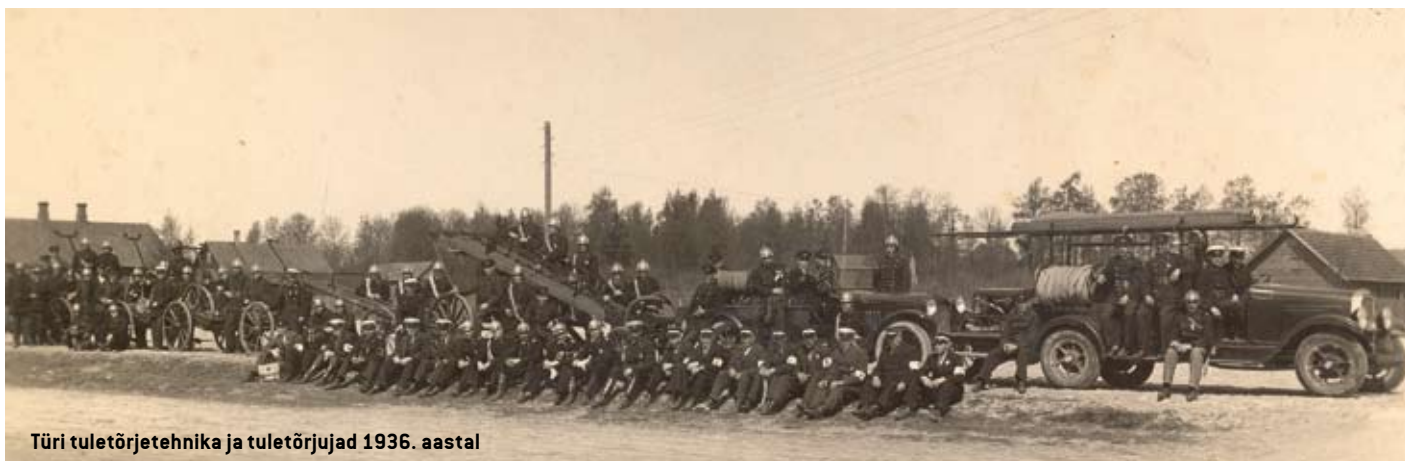
Türi tuletõrjetechnika ja tuletõrjud 1936. aastal

Tuletõrje käsipritsid hajutati. Tuletõrje paakauto Willys ja mõlemad mootorpritsid võeti SARK osakonna käsutusse ja laaditi Türi jaamas rongile. Mootorpritsid päästeti kavalusega rongilt, paakauto aga viidi Tallinnasse, kust see septembris 1941 Nõmme Tuletõrjekomandost kätte saadi. Kaduma jäi autol olnud 200 m voolikuid, kaks joatoru ja kaks presentlikonda.