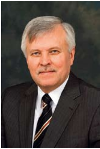
JÜRI PIHL SISEMINISTER

Siseturvalisuse valdkonnas on aastaid tehtud head tööd ning kaitstud kõige hindamatumat väärtust – inimeste elu. Kutseliste päästjate kõrval on suure panuse andnud vabatahtlikud, kes on võtnud vastutuse seista oma kaasmaalaste turvalisuse eest.