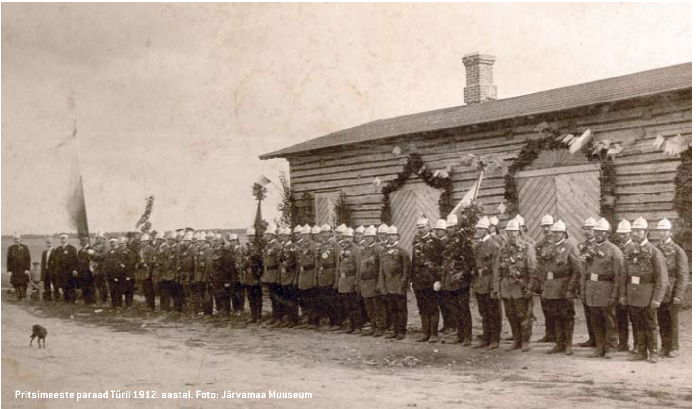
Pritsimeeste paraad Türil 1912. aastal.

Aasta jooksul käidi kustutamas kolme keskmise suurusega tulekahjut, kahel juhul väljaspool Türi (Laupa-Jändja rahvamaja ja Lokuta külas) kokku 110 mehega. Korraldati kaheksa manöövrit ja harjutust kokku 553 mehega ja 84 vahiteenistust 168 mehega. Kustutusvahendite hulk oli oluliselt suurenenud.