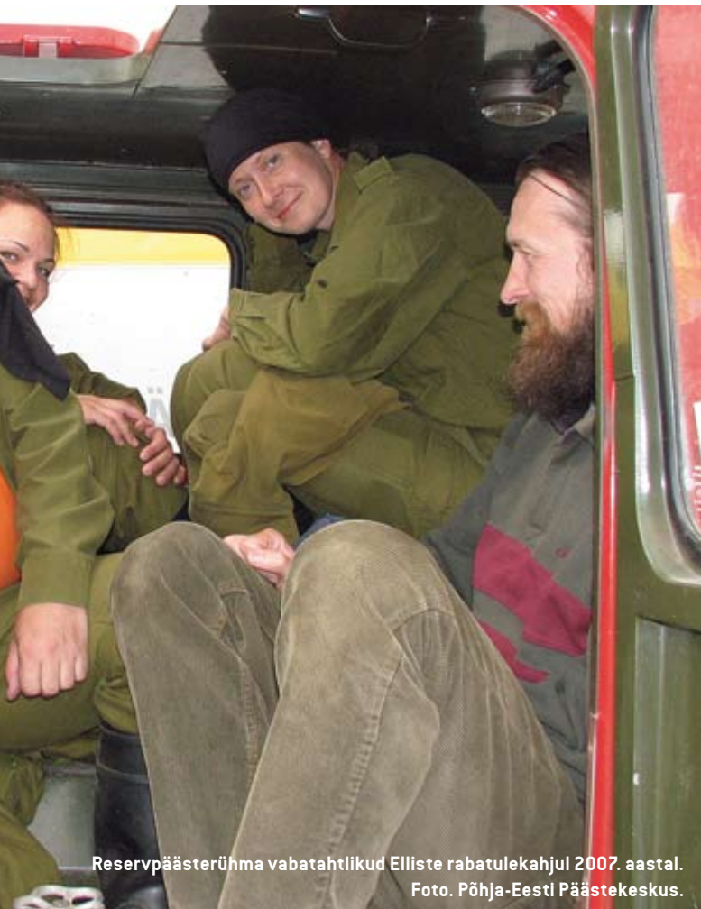
Reservpäästerühma vabatahtlikud Elliste rabatulekahjul 2007. aastal.

ALO TAMMSALU PÄÄSTEAMETI PEADIREKTORI ASETÄITJA