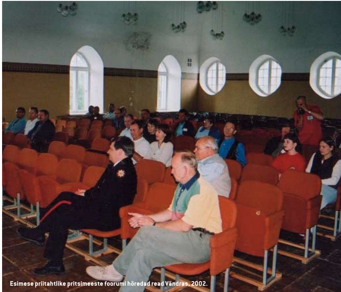
Esimese priitahtlike pritsimeeste foorumi hõredad read Väandras, 2002.

Juhul, kui keegi tunneb, et Päästeameti üleriigilised projektid ega ka päästekeskuse tegevused ei paku vajalikku lahendust just tema kodukoha probleemidele, on võimalus esitada oma nägemus iga aasta septembris toimuvale projektikonkursile.