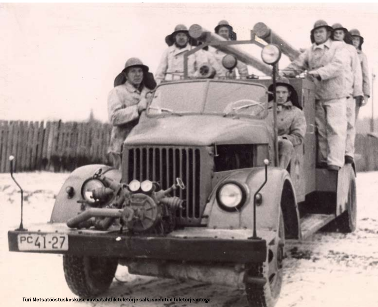
Türi Metsatööstuskeskuse vabatahtlik tuletõrje salk iseehitud tuletõrjeautoga.

7 minuti pärast omast korterist, tehnika oli must, garaazis oli ehitusmaterjale ning teisi kõrvalisi esemeid, veepaakautol oli paak maha tõstetud ning tühi, auto ise läinud majandussõite tegema. Käskkirjas kavandati abinõud olukorra parandamiseks. Kuu aega hiljem, 24. augustil 1946, premeeriti käskkirjaga nr 16 rahaliselt suurte summadega Türi Tuletõrjedisjoni pealikut ning Türi naiskompanii pealikut.