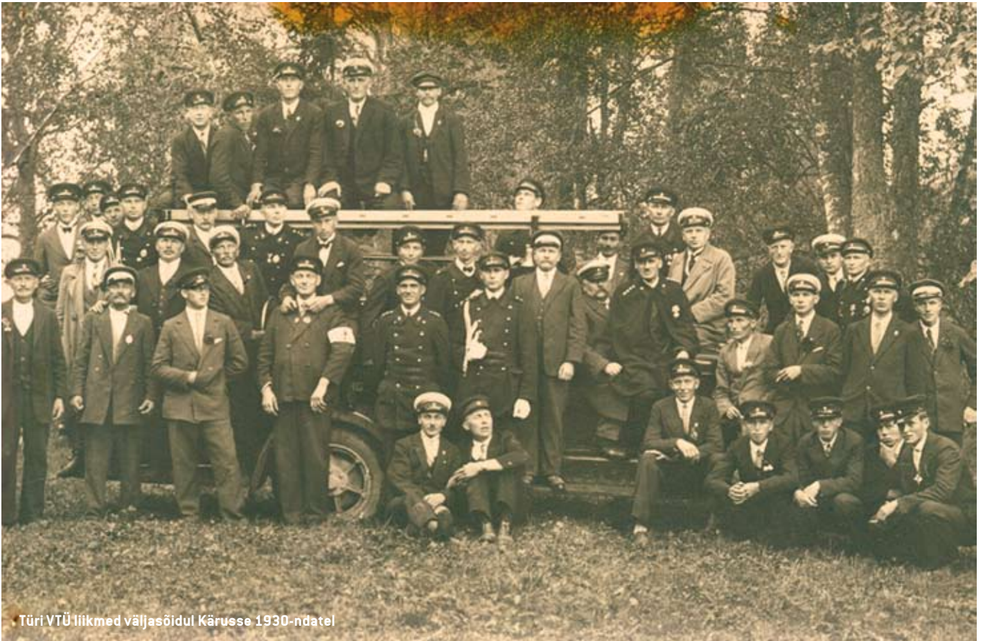
Türi VTÜ liikmed väljasõidul Kärusse 1930-ndatel