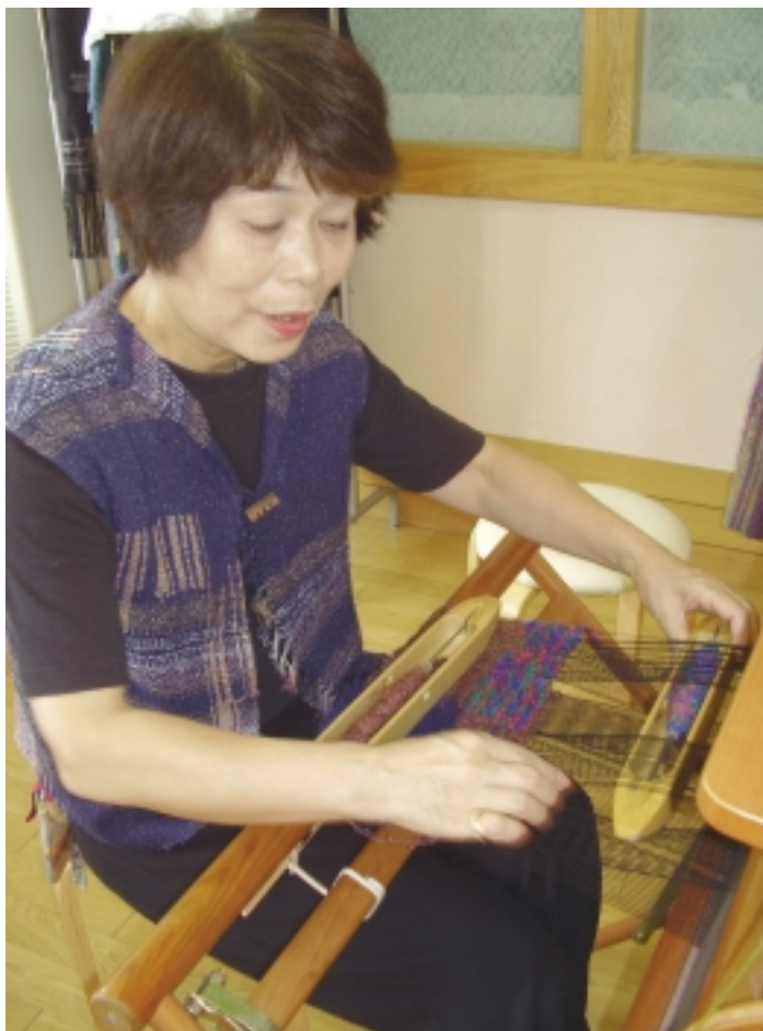
Jaapanlanna kudumas, kandes ise ka vesti, mis kootud saoris.