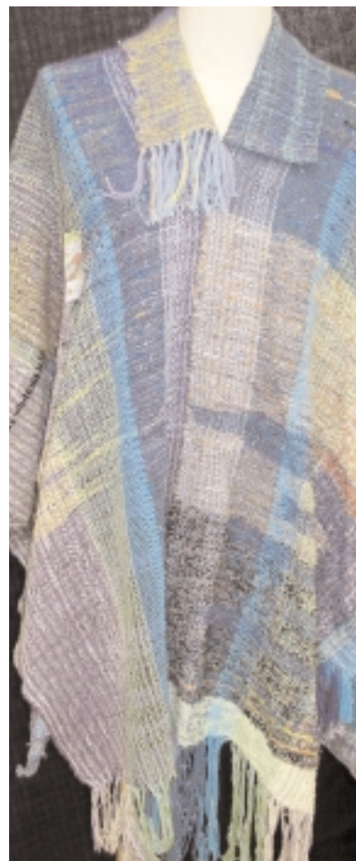
Näide saori kudumist

Tallinna Puuetega Noorte Õppekeskus "Juks" Pihlaka 10, 11211 Tallinn tel 655 9452, faks 655 9512 juks@juks.ee