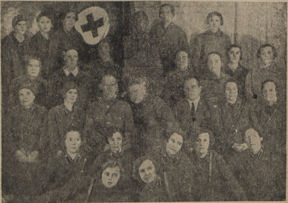
Haridusmaja Punaseristi ring

seerime. Käsitööringi likwideerides suri wälja naiste poliitkool. Kuidas seda uuesti ellu äratada? Üldistest poliitringidest, mis töötawad Haridusmaja juures, peawad ka naisseltsilised osa wõtma. Sest ka naine peab tundma ja õppima poliitilisi ja majanduslisi wõitluseküsimusi. Poliit-