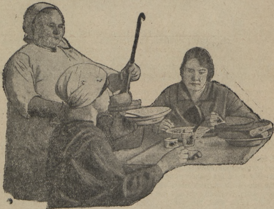
Ühistoidu jagamine „Trud-Kummolowos