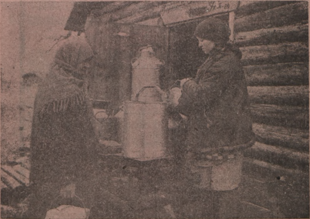
Talunaisterahwas J. Walter koll.-majap. „Idee“ (Wolossowo r.) täidab piimanormi ületamisega

„РАБОТНИЦА И КРЕСТЬЯНКА“ на эстонском языке