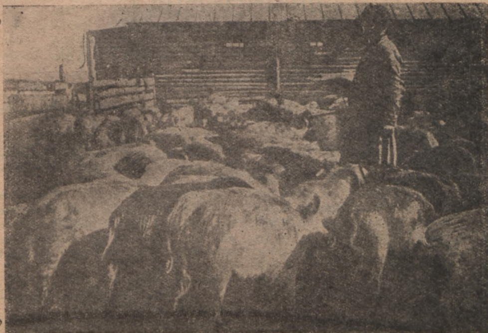
Sead kollektiivmajapidamise lauda juures.

1 miljardi rublani." (Partei XVI kongr. resolutsioon.)