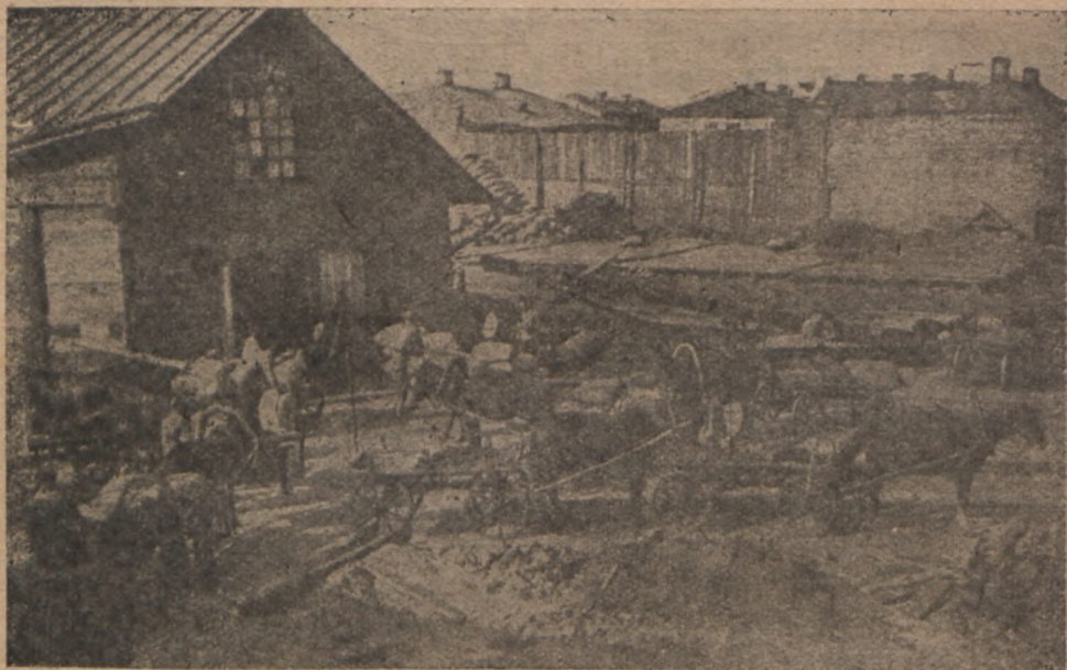
Kollekiiwmajapidamiste punane aiawiljawoor

Kokkuostu kaasaitamise komisjoni- desse, mis küla kollektivistide, kehwi- kute ja keskmikkude üldkoosolekul wal- litakse, tuleb tõmmata võimalikult rohkemal arwul talunai sterahwaid, nende osawõtt kindlustab tingimata edukat kokkuostu. See on iseäranis tähtis weel sellepärast, et just kulak, talunai sterahwaste arenematust ja nende mähajäämist ära kasutades, püüab nende kaudu kokkuostu-hoogtööd takis- tada ja lõhkuda.