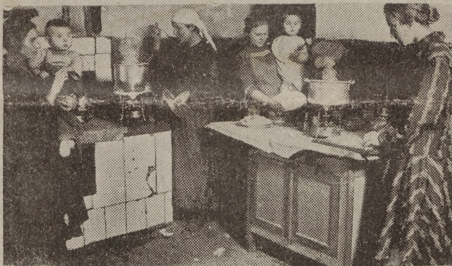
Valimispäeval. „Kuttu jõgid valmis ja valimisele“

Rahmusvaheliseks naistöolistepäemaks 8. märtsiks 1927