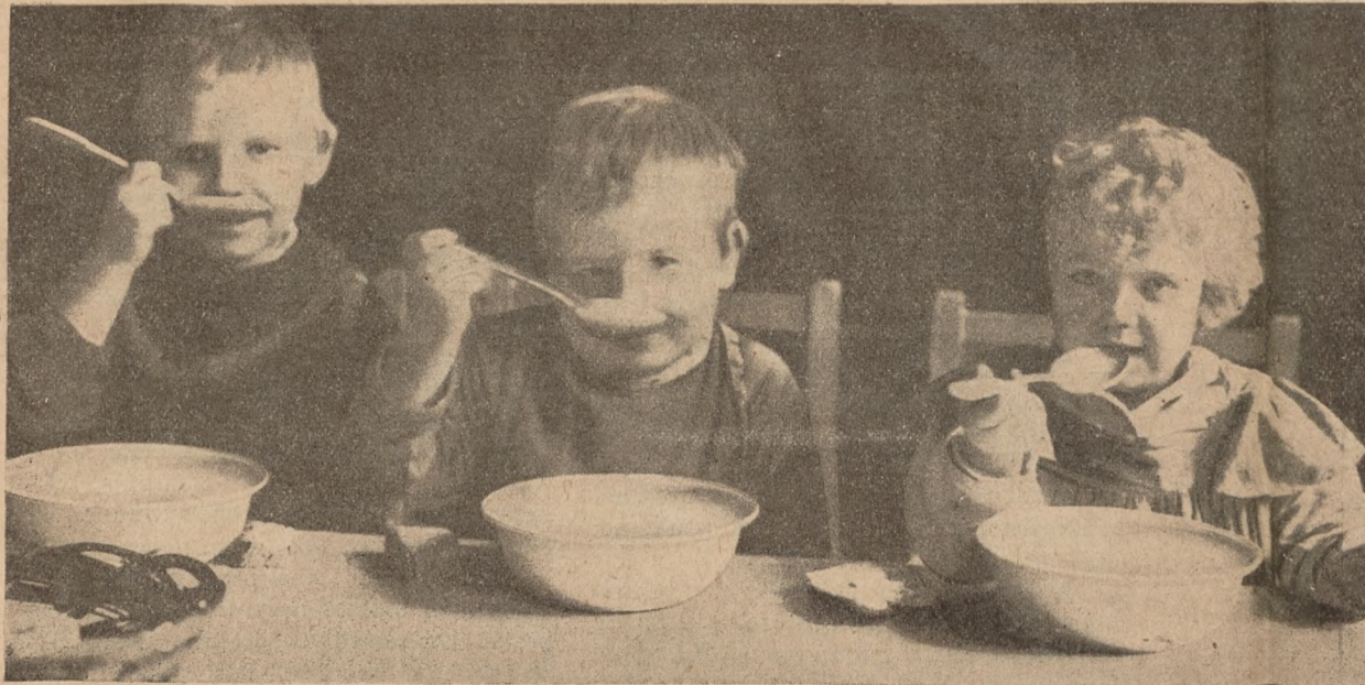
Leeningraadi tööliste lastemajas. Lõunetund.

korraldatakse veel ketramiseõhtuid, kus koostöötamise ajal ajalehti ehk mõnda huwitavat raamatut ette loetakse.