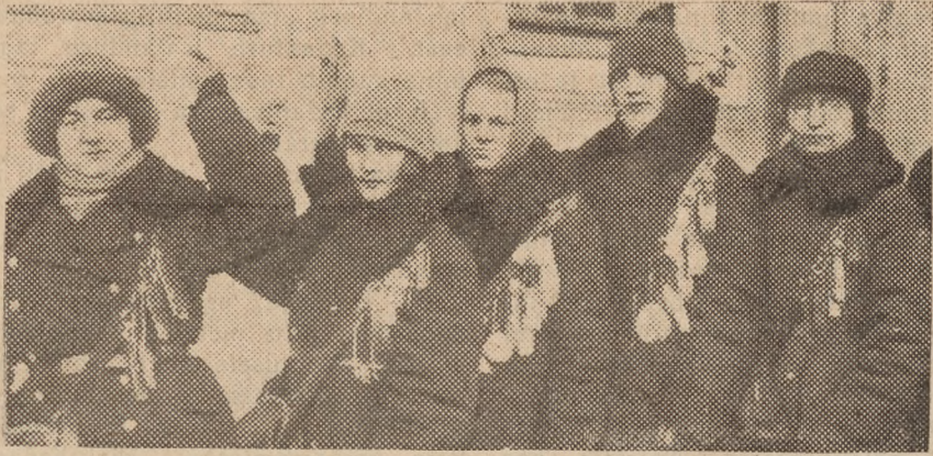
Leeningraadi tramwai-konduktorid lähewad walimistele