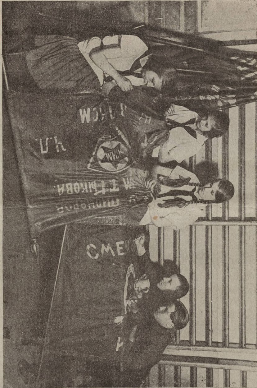
Pioneerid „Pinnas Pütilovis“