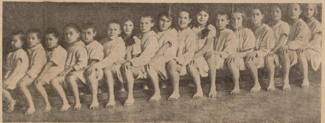
Leeningraadi tööliste lastemajas. Kehaharjutusetunni algul.

Tellimiseaadress: Ленинград, Фонтанка 53, „Кюльвая“