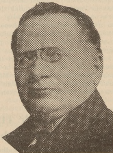
Sm. Litwinow — Nõukogude L. wäliskomisar, kes esitas Idapakti ja wõitleb kõigi abinõudega rahu alalhoidmise eest maailmas.