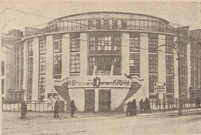
Nõukogude riik teeb määratu suuri tööd tööliste ja kollektiivmajapidajate ning kogu töörahva kultuurilise tasapinna tõstmiseks. Ehitatakse tuhandeid tööliste klubisid, kultuurimajasid, teatrisid jne, kus töölistel oma vaba aega kultuuriliselt mõõda saavad ning ennast kultuuriliselt arendavad. Käesoleval pildil üks niisugune uus tööliste klubi