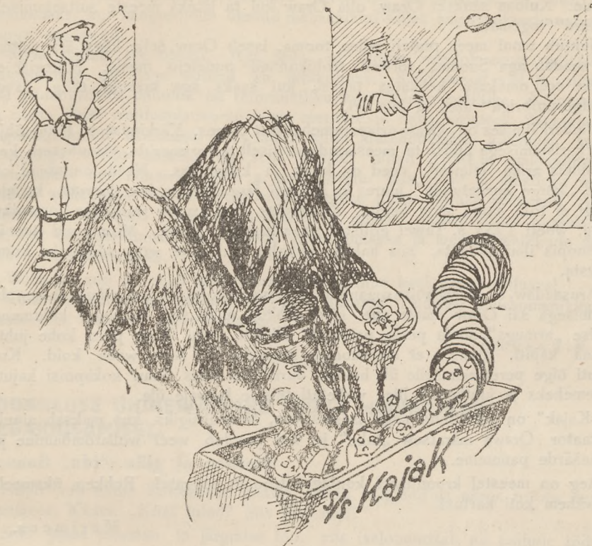
Kapten Oraw „prouaga“ meeskonna lobi peal.

nurumise peale kõigest 20—30 senti tunnis, palgaraamatus on aga ületunnihind ettenähtud 40 senti. Hakkad nõudma, ähwardab jalamaid kaile wisata.