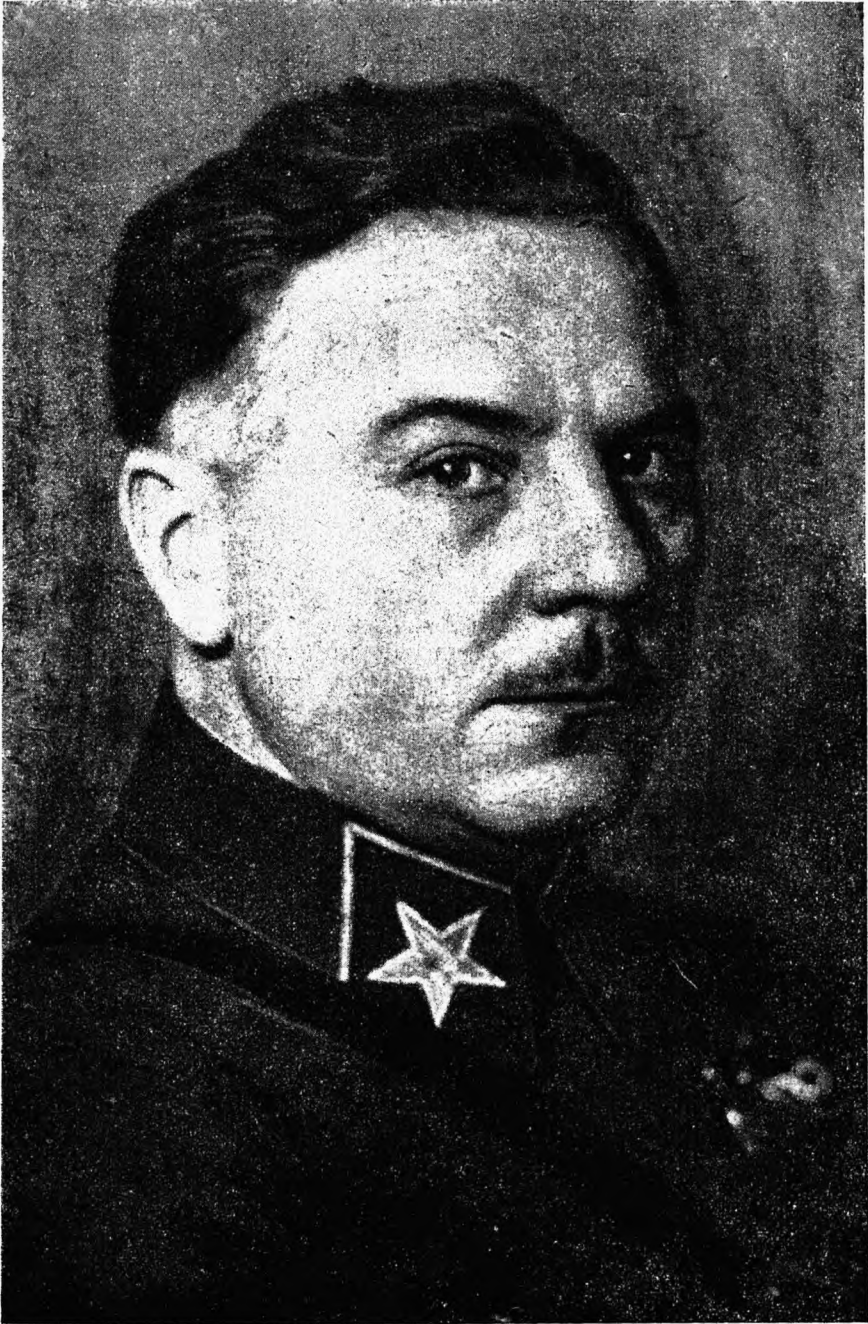
KLIMENTI JEFREMOVITSH VOROSCHILOV, Liidu Nõukogu saadiku-kandidaat Minski linna valimis- ringkonnas, Valge-Venemaal