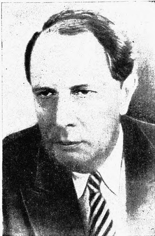
Aleksei Nikolajevitsh Tolstoi, Liidu Nõukogu saadiku-kandidaat Staraja-Russa valimis-ringkonnas, Leningradi oblastis

põhiseaduse elluviimise eest võitlemise aja- järku (1935—1937. a.).