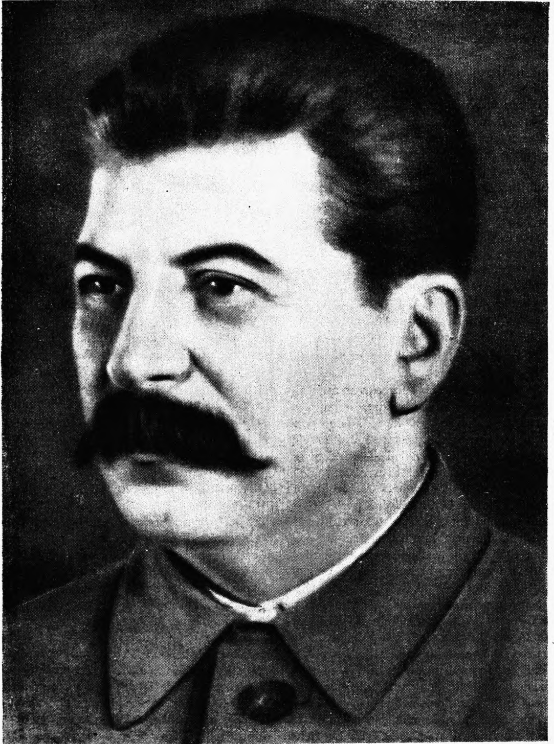
JOSSIF VISSARIONOVITSH STALIN, Liidu Nõukogu saadiku-kandidaat Stalini vali- mis-ringkonnas, Moskvas