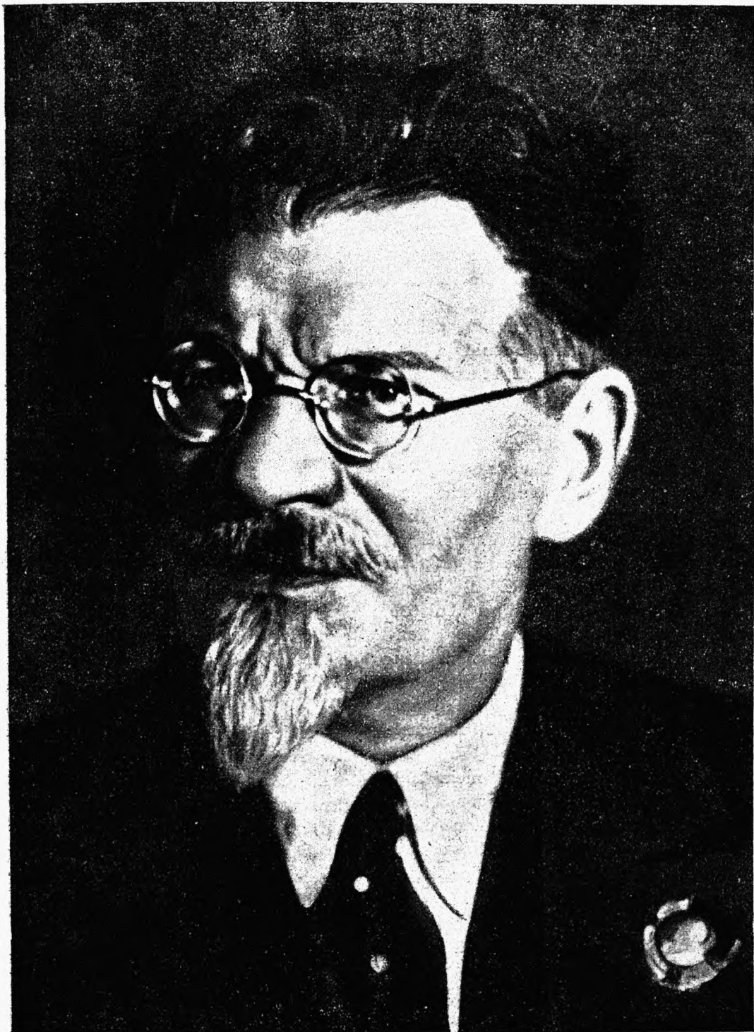
MIHAIL IVANOVITSH KALININ, Rahvuste Nõukogu saadiku-kandidaat Leningradi linnas