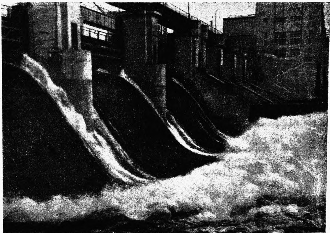
Soitri hüdroelektrijaam 3. Veekukkumine läbi tammi. Parem pool eemal — jõujaam.

Tsuruga sadamasse, kust meie poisid lõpuks mere kaudu Vladivostokki jõudsid.