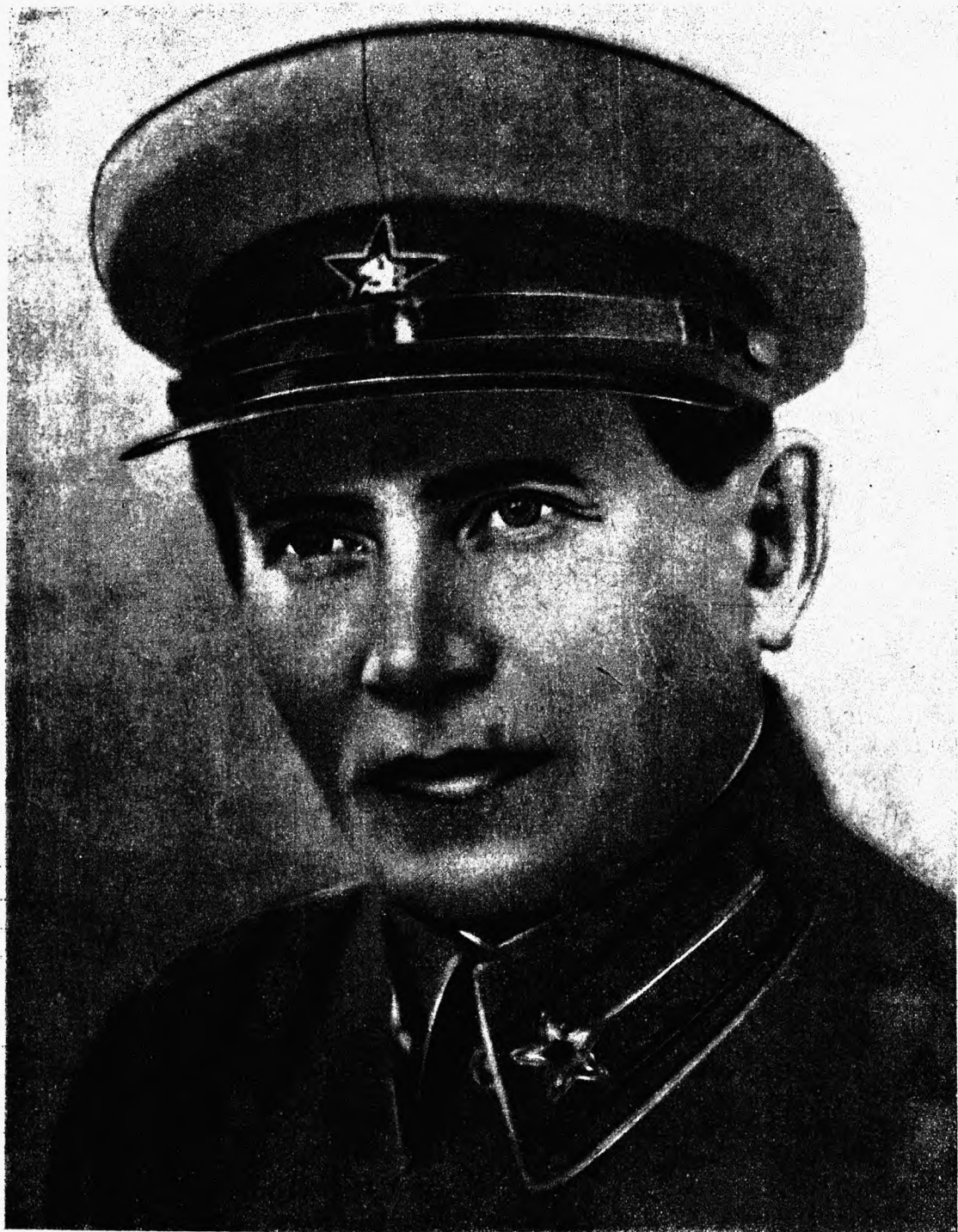
NIKOLAI IVANOVITSH JESHOV, Liidu Nõukogu saadiku-kandidaat Gorki- Lenini valimis-ringkonnas, Gorki linnas