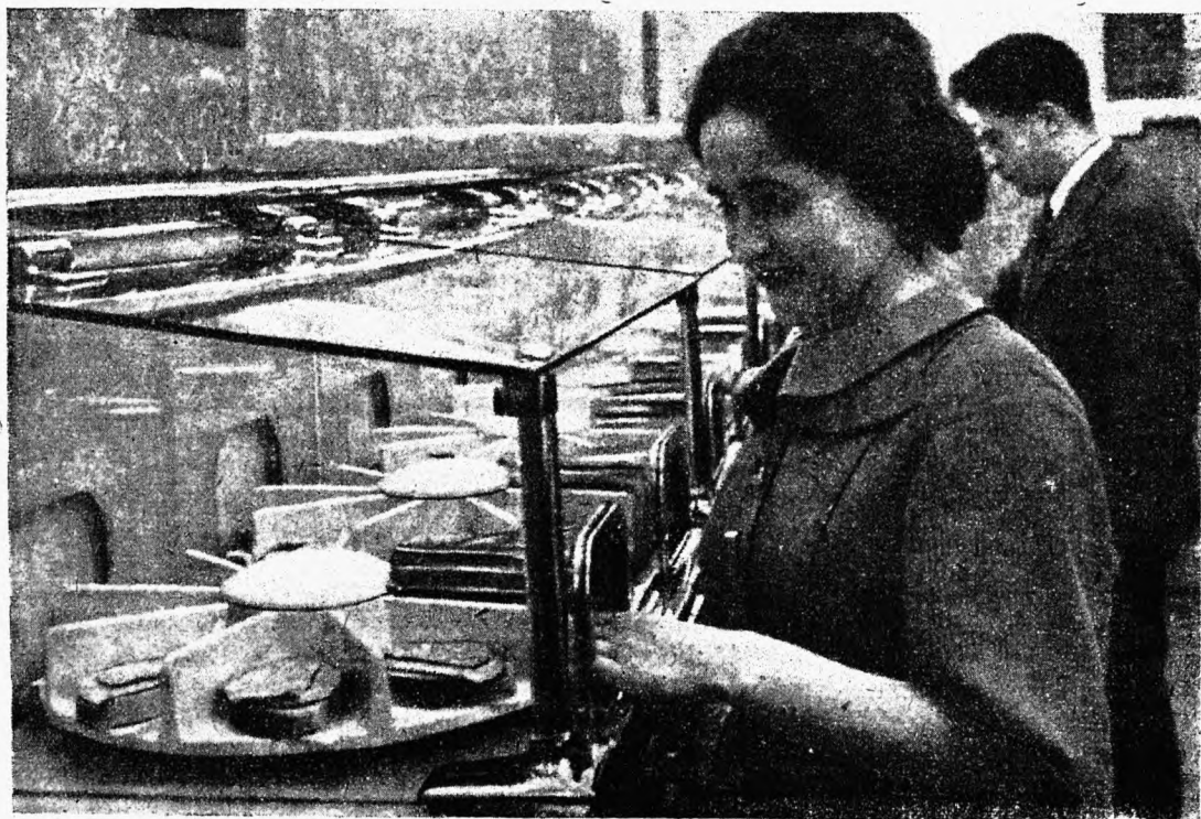
Dershinski platsi ja Malo-Tsherkasski põikaulitsa nurgal Moskvas avati hiljuti automaatne suupistete restoraan.

Elagu Marxi-Engelsi-Lenini suur, võitmatu lipp! Elagu leninism!